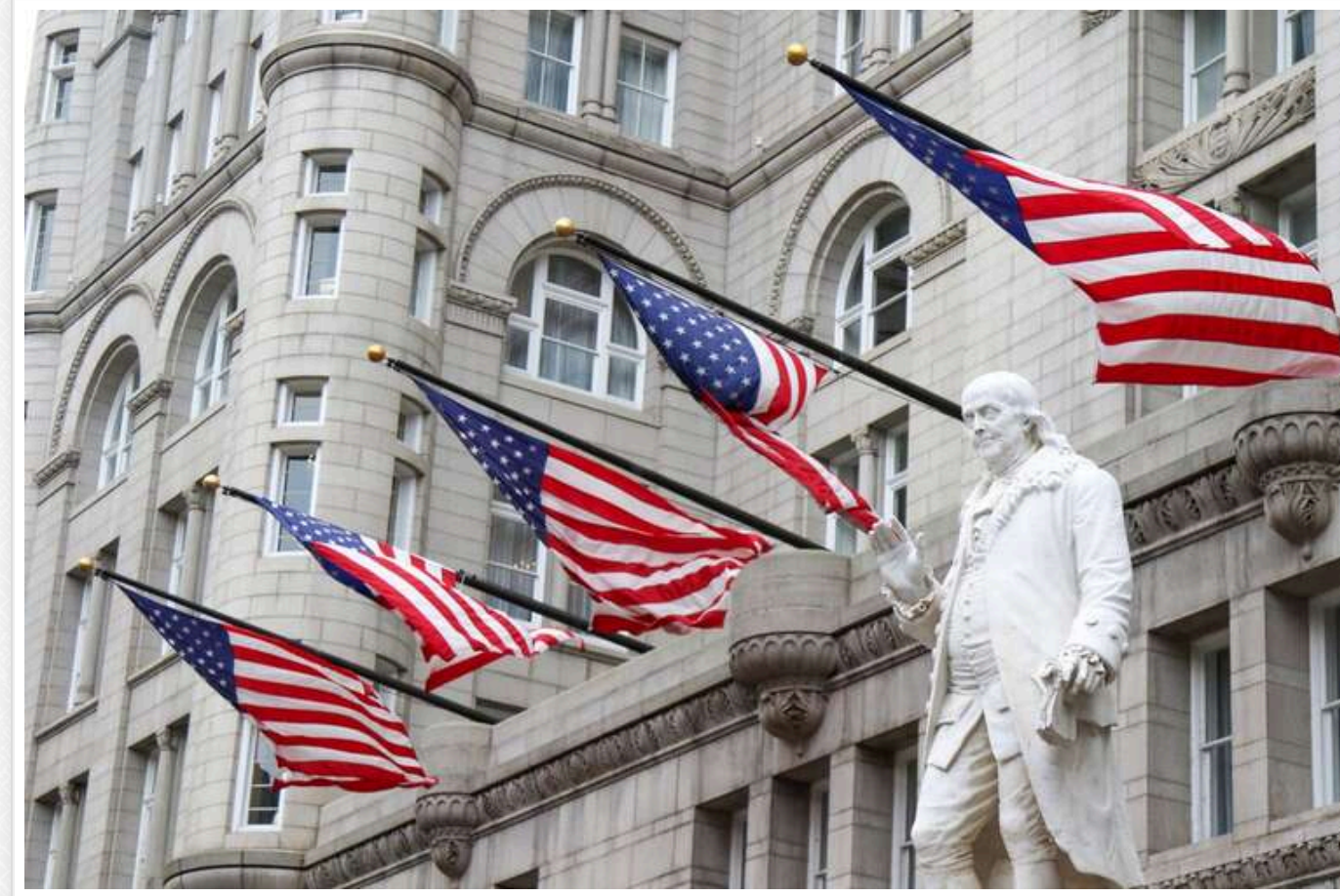
США готові розморозити 6 мільярдів доларів для Ірану на гуманітарні потреби, — WSJ

Вашингтон має намір розморозити іранські активи на $6 млрд: кошти підуть на закупівлю продовольства та ліків, повідомляють ЗМІ.