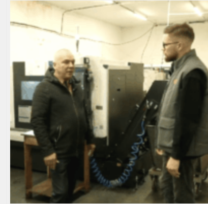
Верстати для «Іскандерів». Як обладнання Siemens і Gans досі потрапляє в РФ