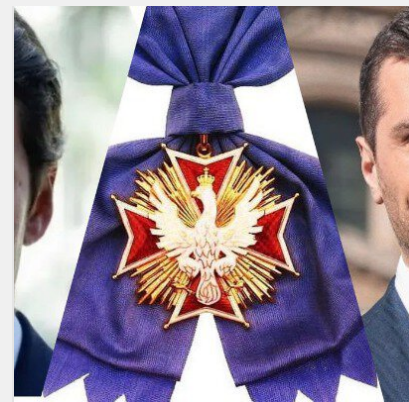
Скандал дійшов до Франції: чому через орден Зеленського ..