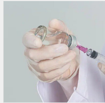
ШІ створив вакцину, яку вже випробували на людях: результат ..