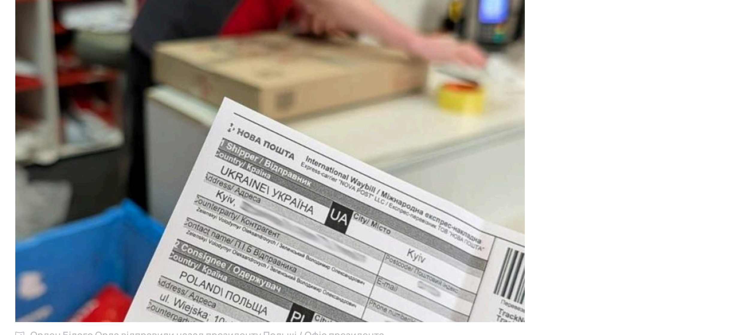
Орден Білого Орла відправили назад президенту Польщі

Генеральний директор "Укрпошти" Ігор Смілянський прокоментував новину про те, що президент України Володимир Зеленський відправив орден Білого Орла до Польщі "Новою поштою" після рішення президента Кароля Навроцького позбавити його цієї нагороди.