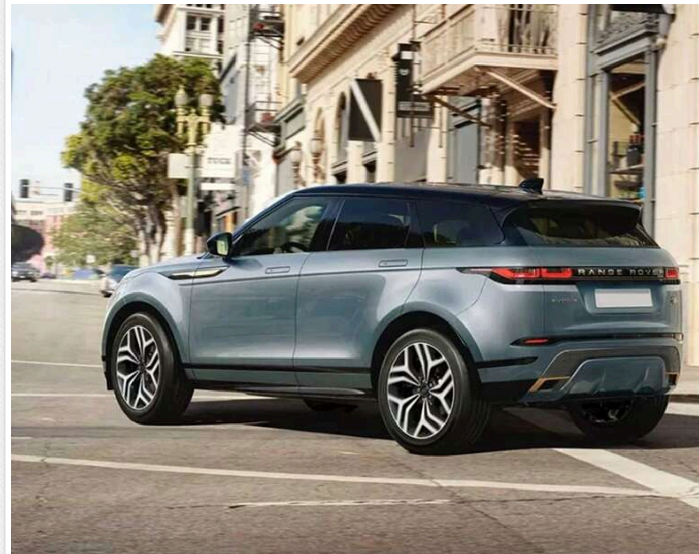
За крок від трагедії: у Кривому Розі авто на шаленій швидкості ледь не збило жінку з дітьми на переході

У Кривому Розі, що на Дніпропетровщині, авто на шаленій швидкості протрало повз жінку з дітьми, які саме збиралися перейти дорогу на «зебрі».