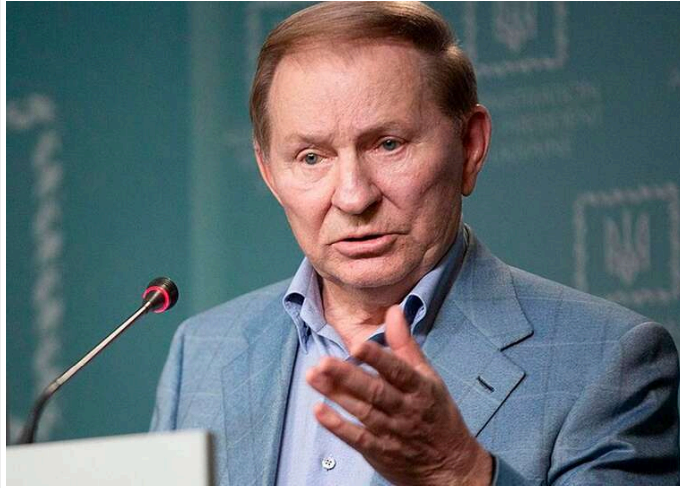
«Не для того Україна прийняла бій»: Леонід Кучма відмовився від найвищого ордена Польщі

Колишній президент Леонід Кучма вирішив відмовитися від ордена «Білий орел», отриманого від Польщі в 1997 році.