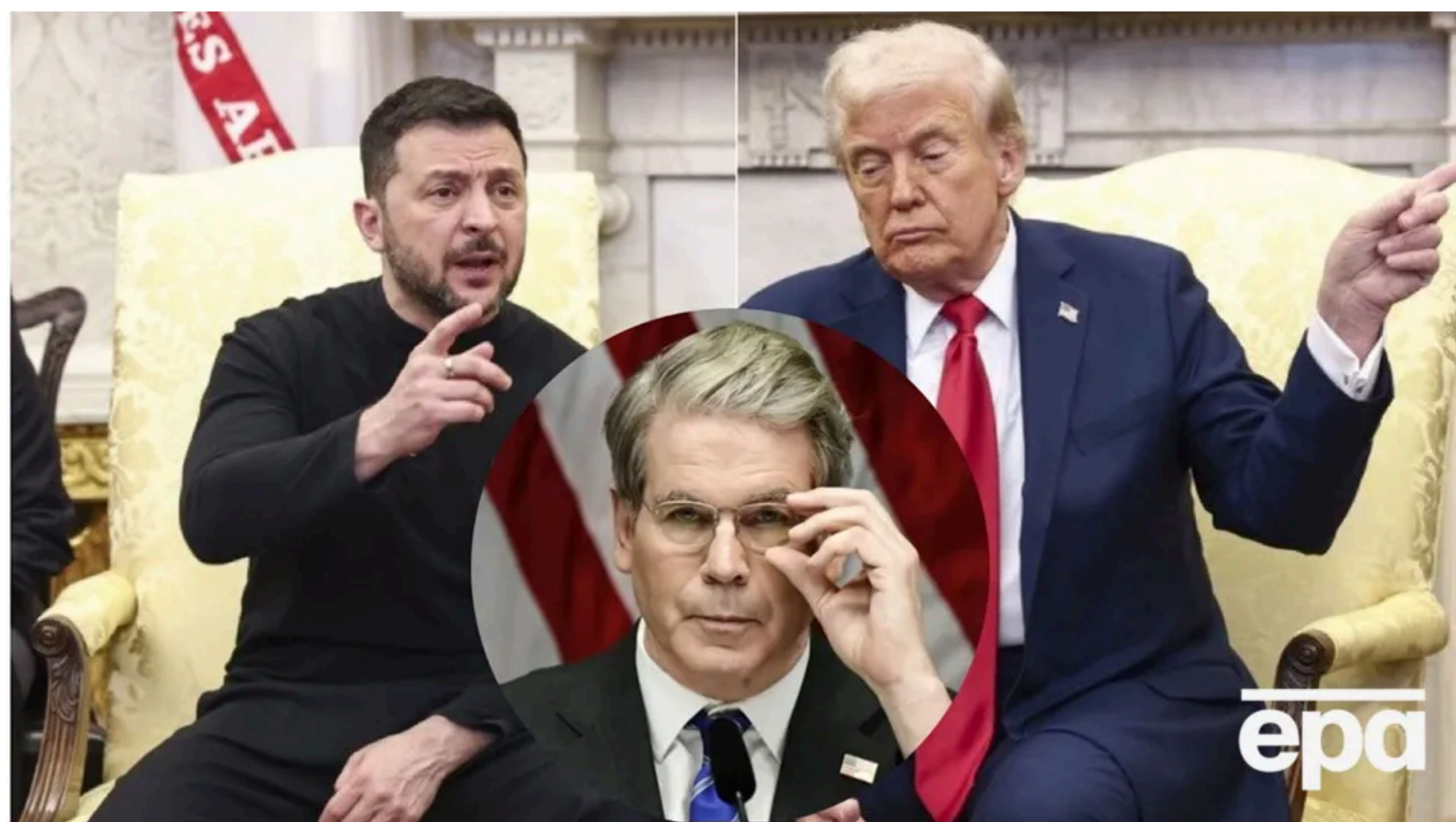
Бессент, за даними журналістів, пропонував не допускати Зеленського в Білий дім, поки той не підпише угоди про мінерали

21 червня, 00:15 🗨️ Этот материал также можно прочитать на русском