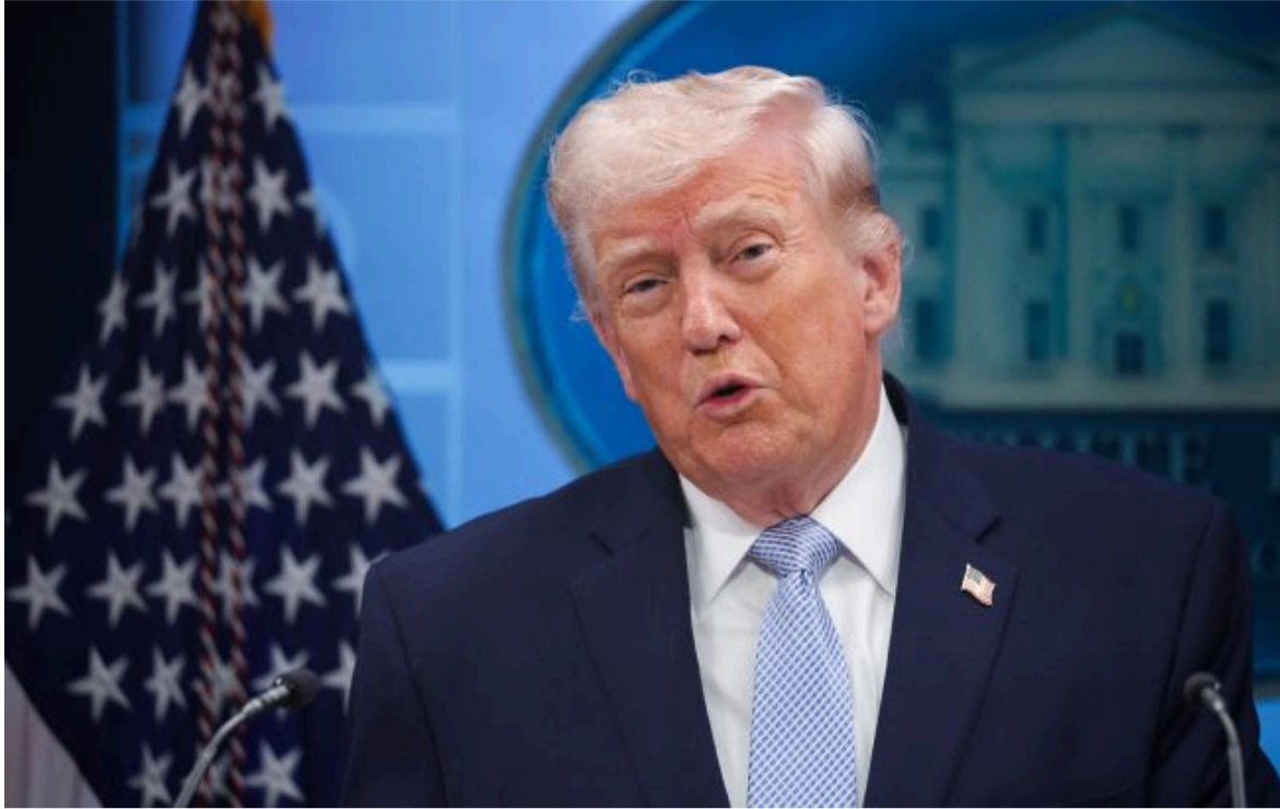
Фото: президент США Дональд Трамп (Getty Images)