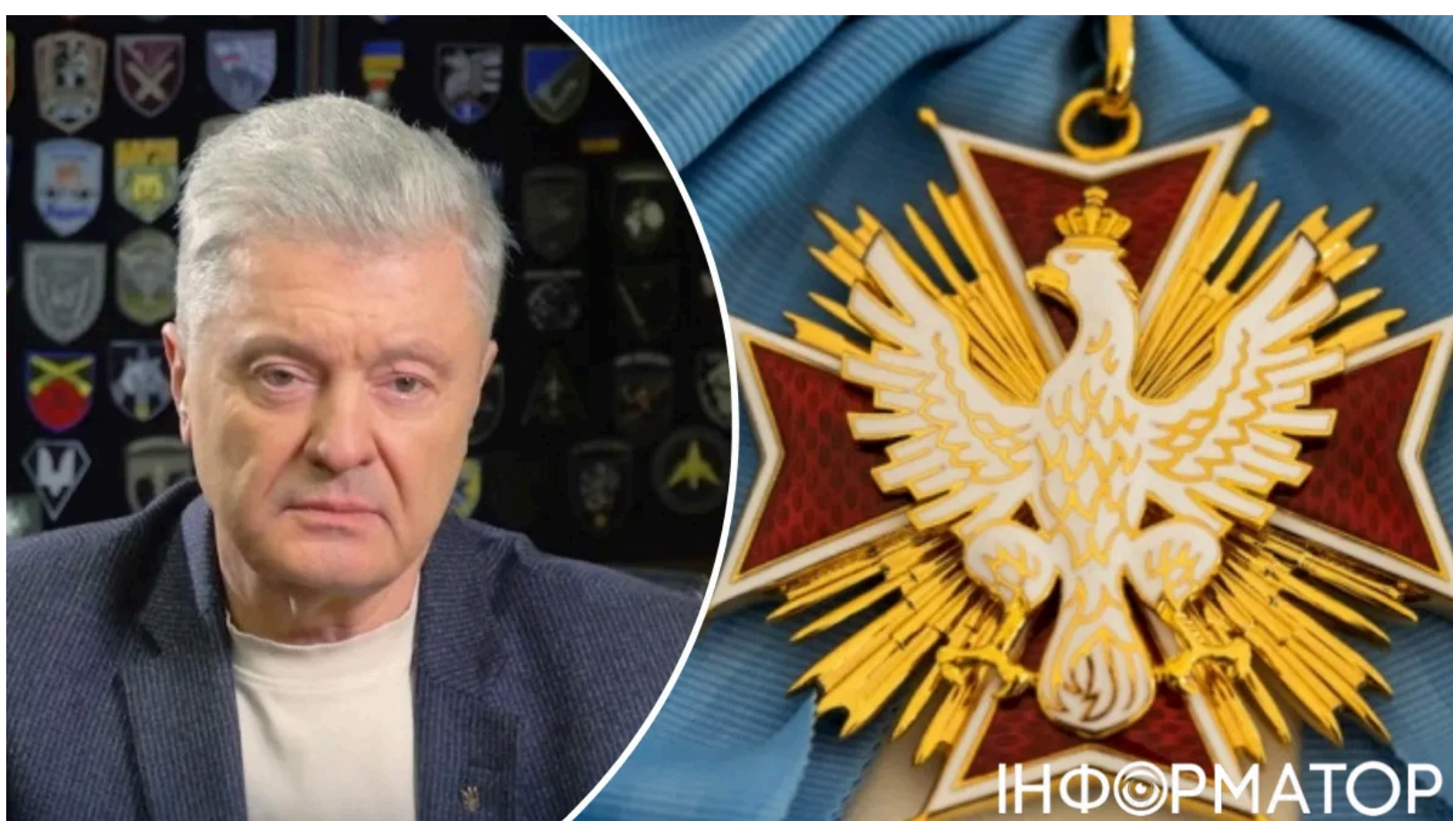
Порошенко відмовився від ордена Білого Орла

П'ятий президент України Петро Порошенко відмовився від польського ордена Білого Орла. Це стало його реакцією на рішення президента Польщі Кароля Навроцького позбавити цієї нагороди чинного президента Володимира Зеленського. Таким чином Порошенко приєднався до Леоніда Кучми та Віктора Ющенка, які 20 червня також повернули свої ордени.