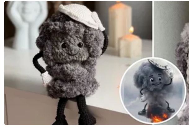
Бавовнятко, яке стало символом наймасованішої атаки на Москву, розірвало мережу. Фото