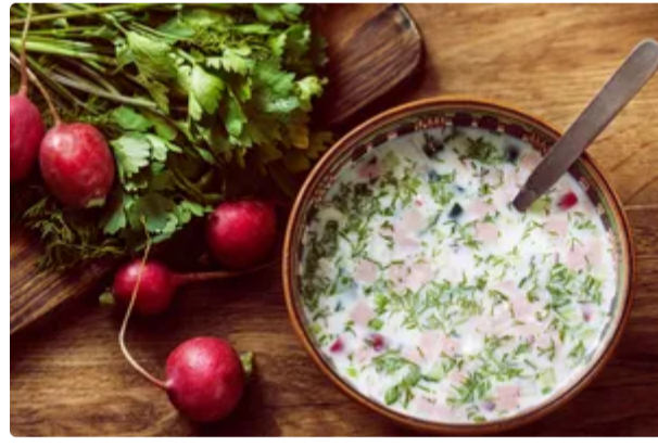
Саме цей інгредієнт в окрошці грає свою видатну роль. Будете здивовані