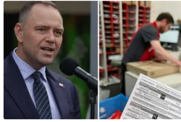
"Посилку зустрічати будете?" Українці прийшли в коментарі до Навроцького – найгостріші реакції