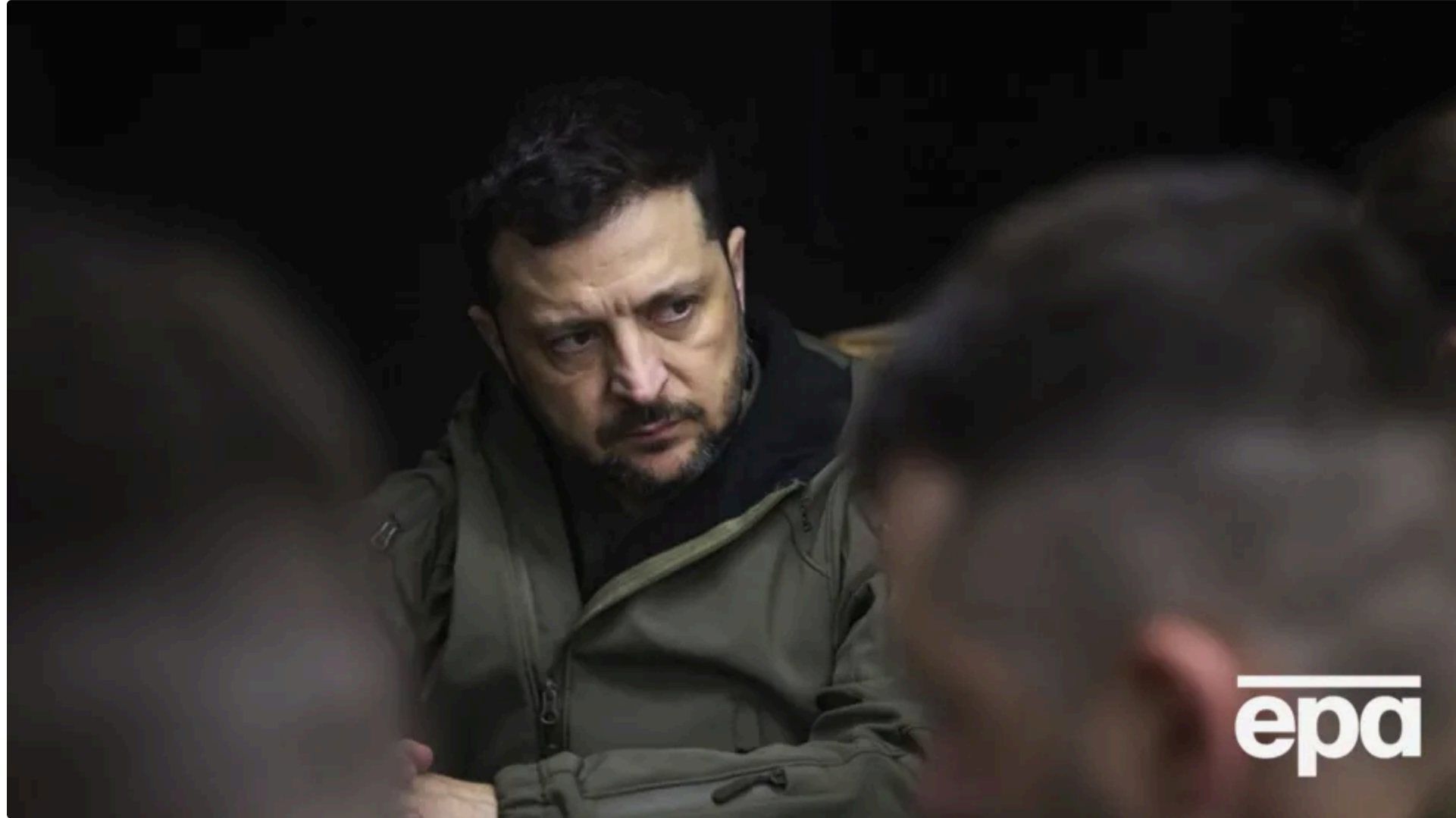
Україна знає про кожен завод у Білорусі, який працює на Росію і на війну проти України, зазначив Зеленський

Україна зафіксувала чотири ретранслятори на території Білорусі, які допомагають країні-агресору РФ завдати удари дронами по українській території. Про це повідомив президент України Володимир Зеленський у вечірньому зверненні 20 червня, стенограму якого опублікувала його пресслужба.