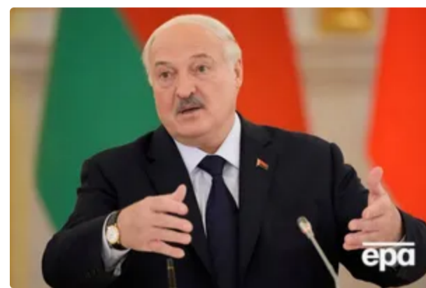
"Можливо, переборщив". Лукашенко попросив вибачення в Зеленського