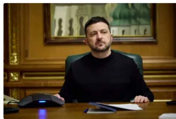
"Якщо він це не зробить, зробимо ми". Зеленський поставив дедлайн Лукашенку