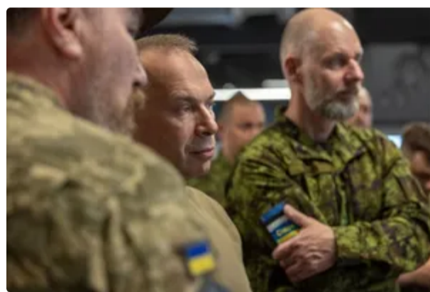
На тлі загроз із боку Білорусі. Сирський розповів, як посилять оборону на півночі