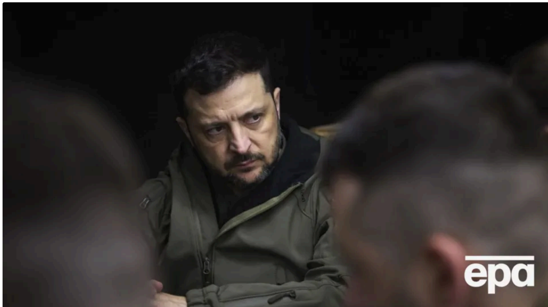
Україна знає про кожен завод у Білорусі, який працює на Росію і на війну проти України, зазначив Зеленський

20 червня, 21:36 🗨️ Этот материал также можно прочитать на русском