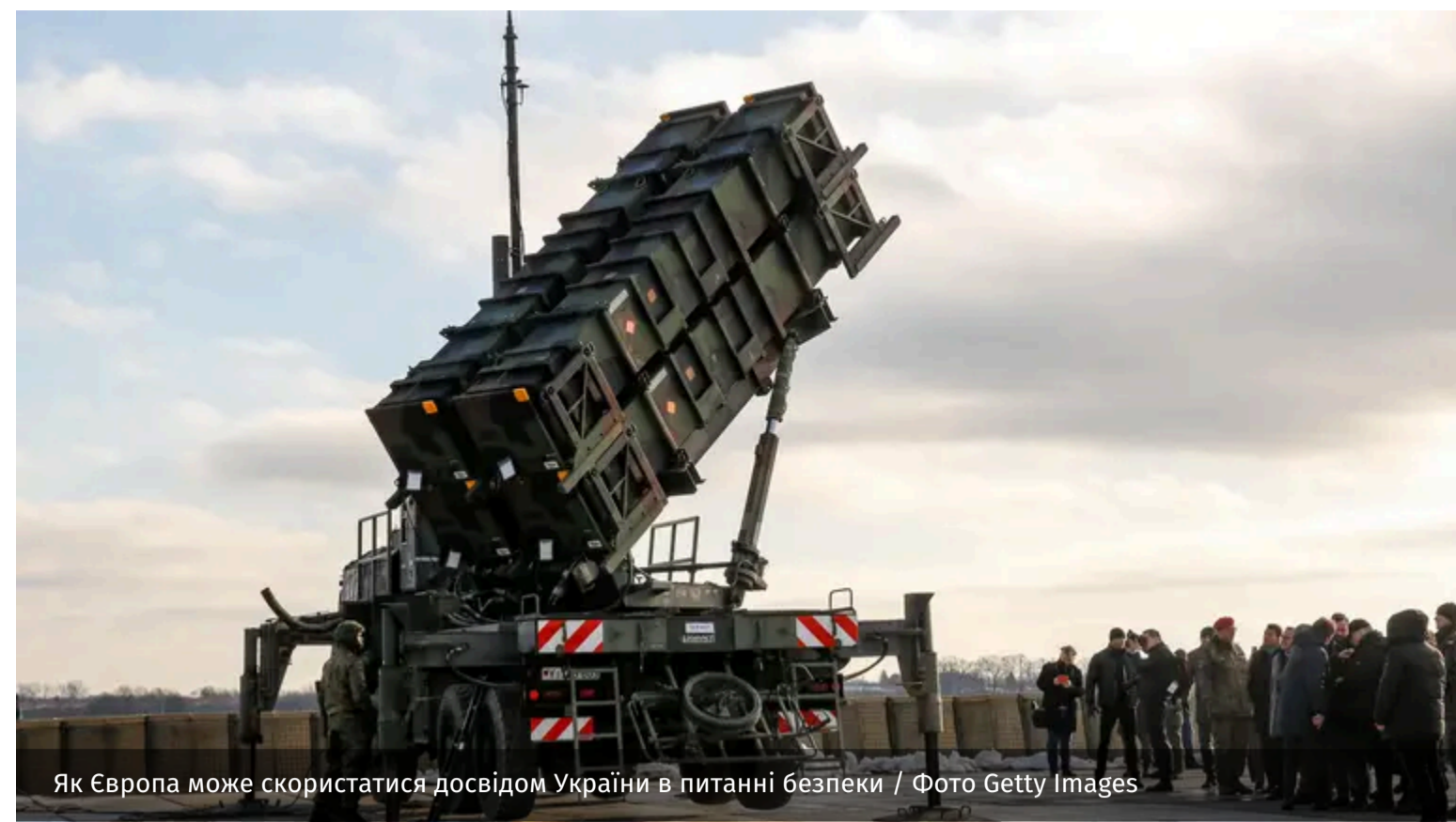
Як Європа може скористатися досвідом України в питанні безпеки

З початком президенства Дональда Трампа Європа усвідомила, що її оборона відтепер у її руках. Тому сьогодні європейські країни докладають зусиль, щоб самостійно захищатися від можливих загроз. І в цьому їм буде дуже корисний досвід України.