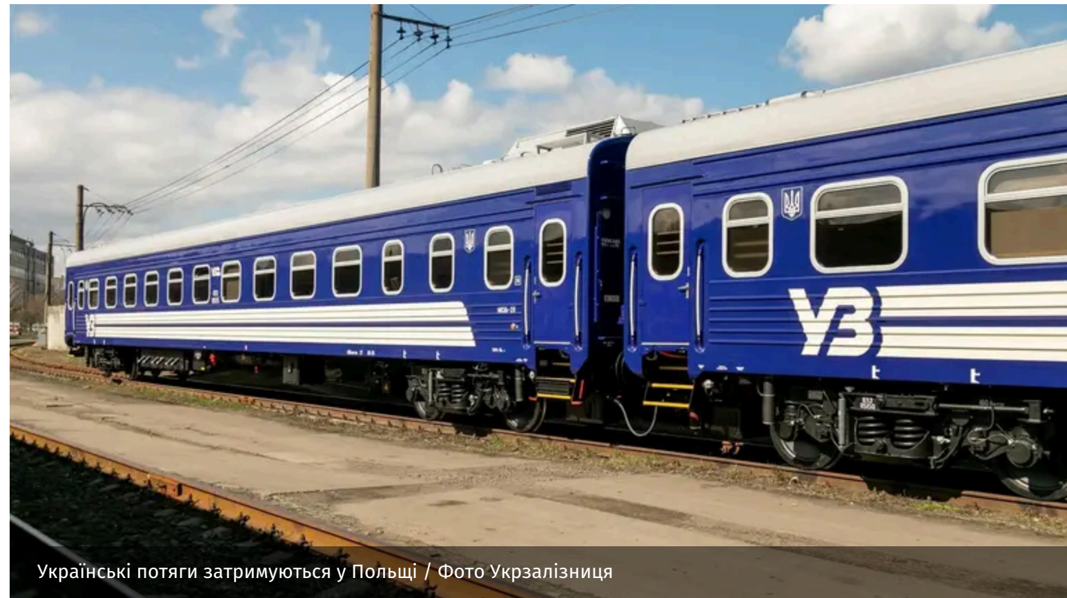
Українські потяги затримуються у Польщі

Потяги, які прямують з Польщі до України, затримуються. Причина – перебої в енергосистемі польської залізниці.