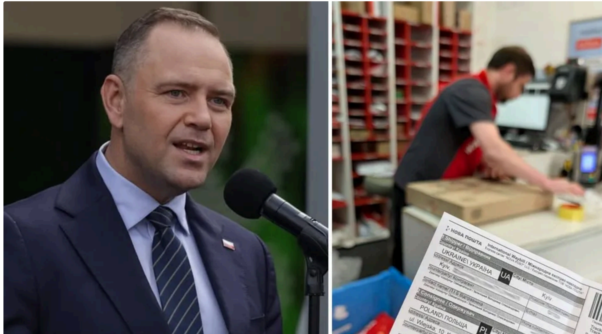
Рішення польського президента розкритикував прем'єр-міністр Польщі Туск

Українці в соцмережі Threads активно коментують пост президента Польщі Кароля Навроцького, який 19 червня позбавив президента України Володимира Зеленського ордена Білого Орла – найвищої нагороди Польщі. Орден Зеленському вручив 2023 року попередній президент країни Анджей Дуда .