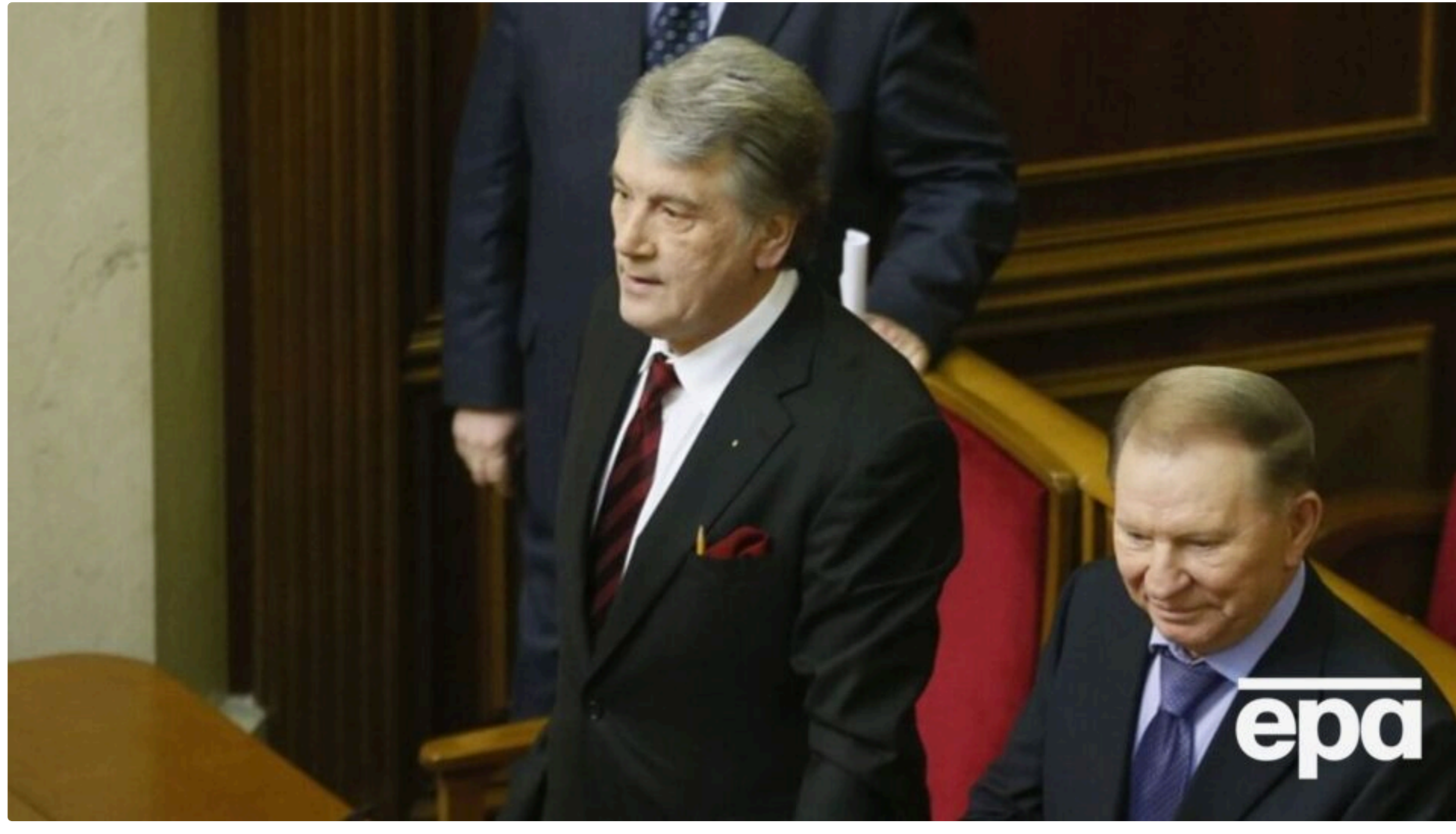
Ющенко й Кучма відмовилися від найвищої нагороди Польщі

20 червня, 20:32 🗨️ Цей матеріал також можна прочитати на російському