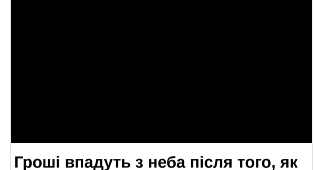
Сукні, що роблять образ незабутнім

Якщо з'явилися варикозні вени або синошні вузли, застосуйте це