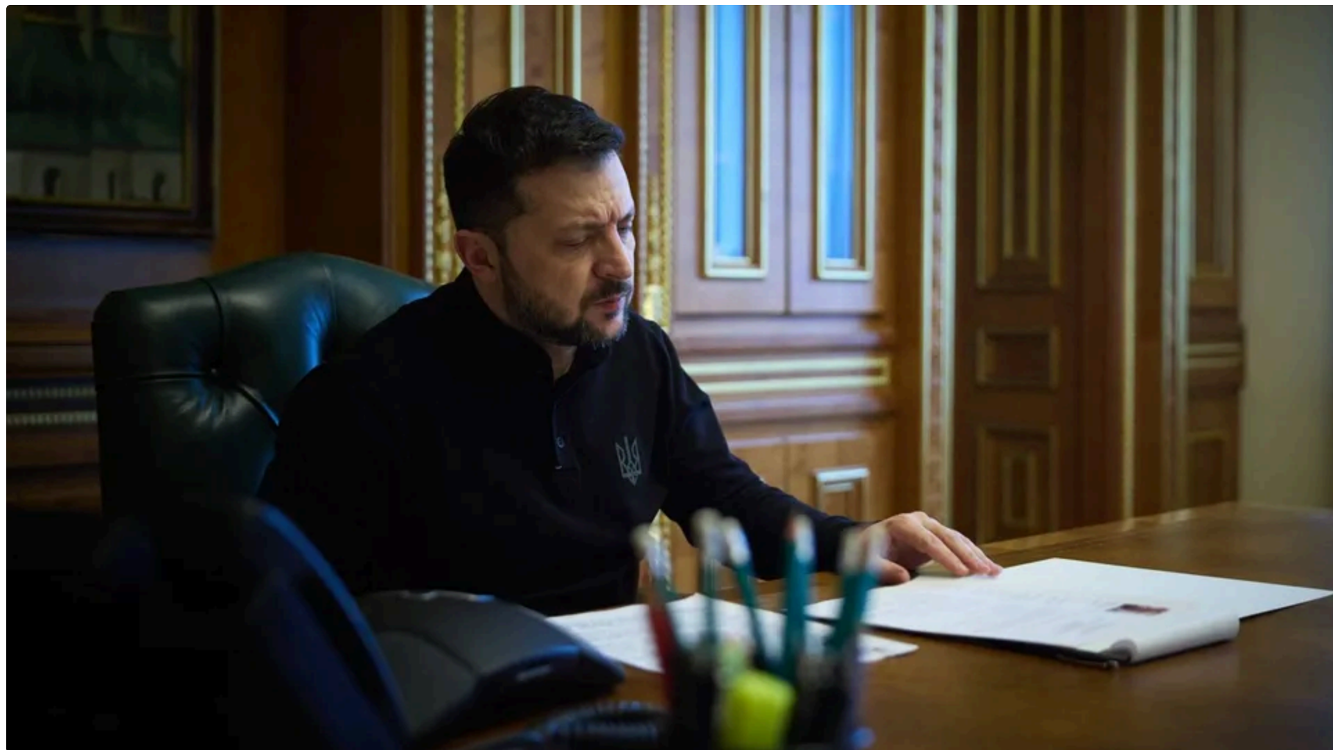
За пересилання заплатив відправник – готівкою

20 червня, 21:05 📧 Цей матеріал також можна прочитати на руском