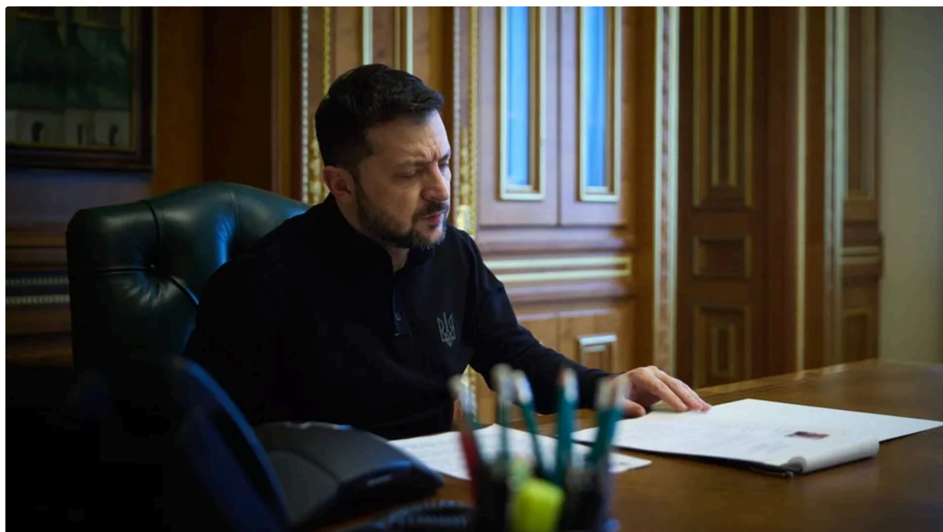
За пересилку заплатив відправник – за готівку

Президент України Володимир Зеленський відправив президентові Польщі Каролю Навроцькому орден Білого Орла компанією "Нова пошта" і сам оплатив доставку. Про це стало відомо із опублікованих 20 червня Зеленським фото в Telegram.