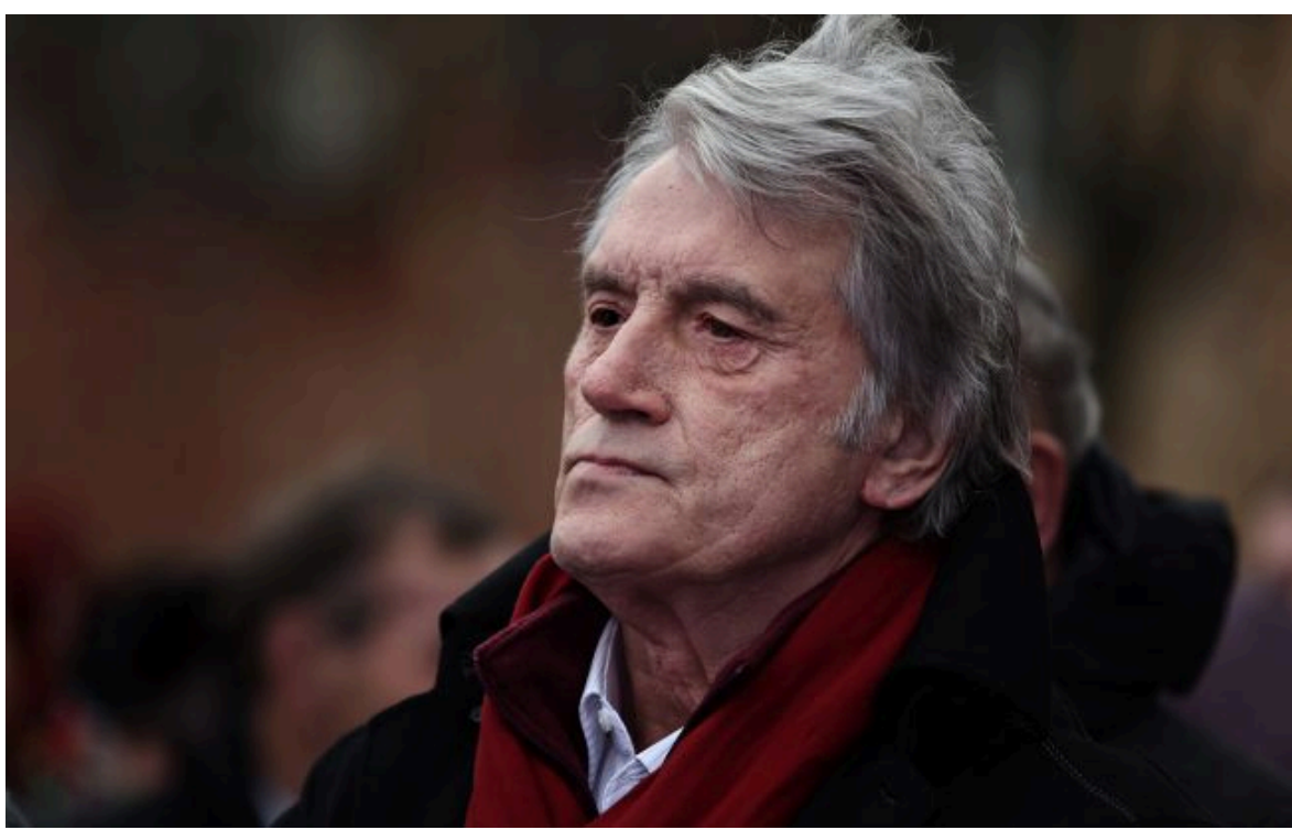
Фото: Віктор Ющенко (Getty Images)