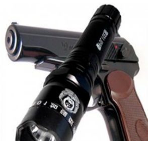
Потужна легальна зброя від бандитів! Розпродаж!

І хоча після невдалого контрнаступу 2023 року анонси того, що Україна от-от звільнить Криму, сприймати скептично, зважаючи на те, що кажуть жителі окупованого півострова, про даними речника ВМС ЗСУ Дмитра Плетенчу повідомляється висадження українського десанту