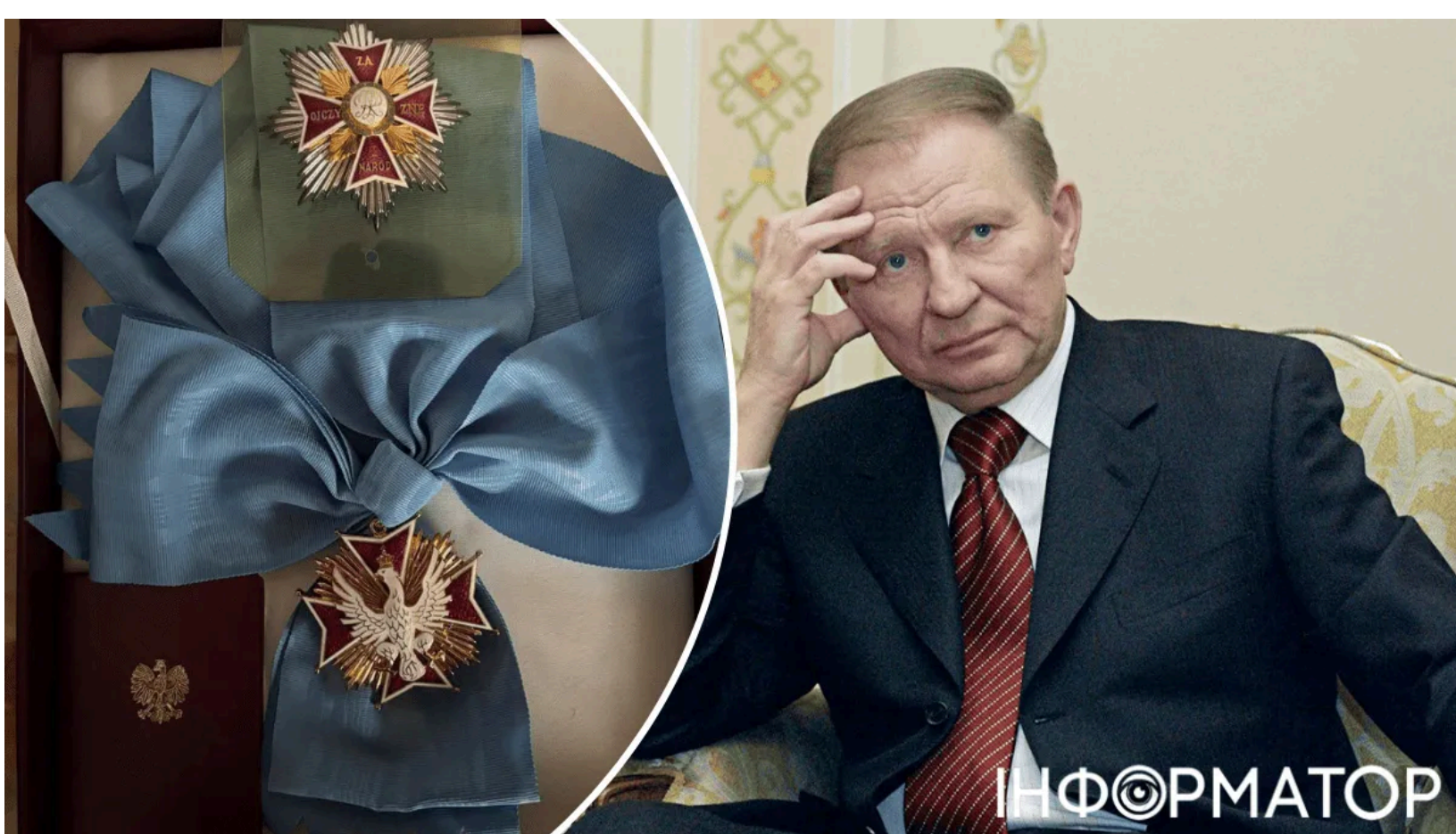
Кучма відмовився від польського ордену Білого Орла

Другий президент України Леонід Кучма заявив про відмову від польського ордену Білого Орла, яким його нагородили у 1997 році. Раніше орден Білого Орла від Польщі отримав і чинний президент Зеленський. Кучма пояснив своє рішення тим, що не може зберігати нагороду після того, як Польща позбавила її Зеленського. Таким чином колишній глава держави висловив солідарність з чинним президентом та відреагував на гострий дипломатичний скандал між двома країнами.