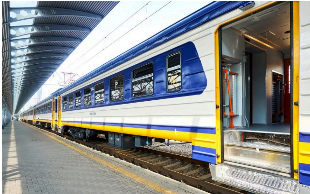
Міжнародні поїзди до України відправлятимуться із затримкою