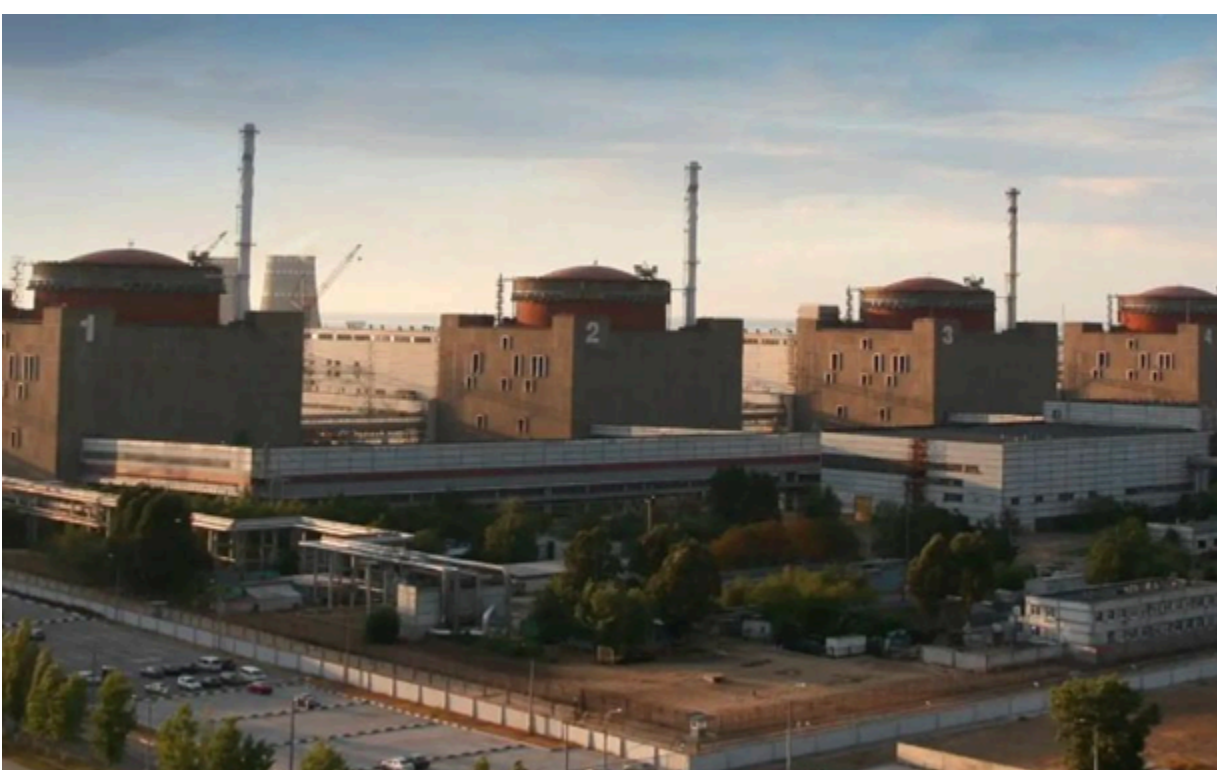
Запорізька АЕС окупована росіянами з березня 2022 року

Наразі власні потреби станції забезпечуються від повітряної лінії електропередачі напругою 330 кВ.