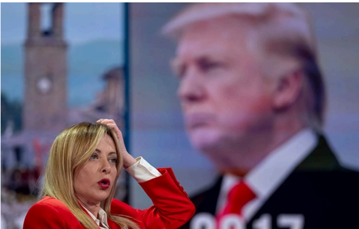
Дональд Трамп пішов на ескалацію суперечки з Джорджею Мелоні

Конфлікт між політиками відбувся після саміту G7. Трамп стверджує, що Мелоні "благала його про фото", та - заперечує.