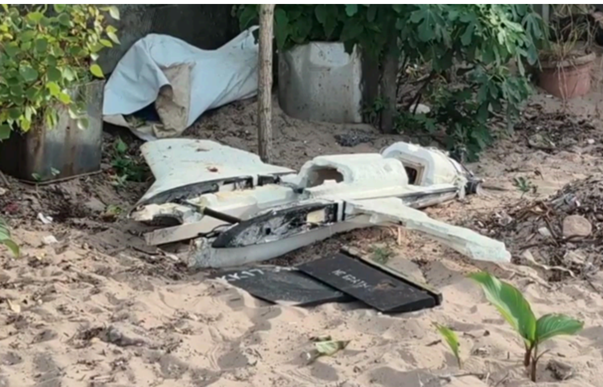
Безпілотник знайшли на турецькому пляжі Чаказ у районі Амасра

Дрон може бути російського виробництва, однак його точне походження мають встановити після дослідження.