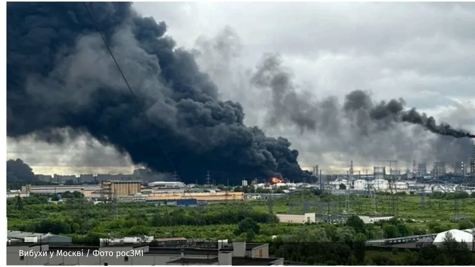
Вибухи у Москві

Системні атаки дронів по Москві виявили, що російська влада свідомо не запускає повноцінні системи оповіщення населення про повітряні загрози. Причина, ймовірно, полягає не лише в технічних обмеженнях, а й у політичному небажанні визнавати масштаби ударів.