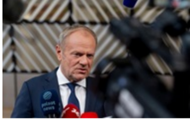
Туск відреагував на позбавлення Зелєньського Ордена Білого Орла 00:58

"Рішення позбавити президента України ордена Білого орла - це стратегічна помилка президента Польщі, від якої виграє лише Москва. Нам шкода, що емоції взяли гору в Варшаві та змусили йти на невинуваті, імпульсивні та зневажливі кроки в бік навіть не президента Зеленського, а насамперед Української держави", - наголосив міністр закордонних справ України.