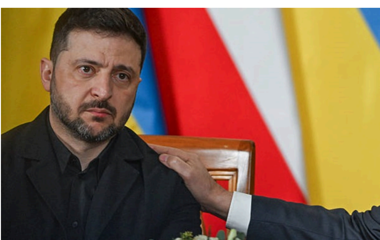
Скандал між Польщею і Україною щодо історичного питання набирає обертів

Низка українських чиновників проявили солідарність у відмові від польських нагород після рішення Варшави позбавити Зеленського Ордена.