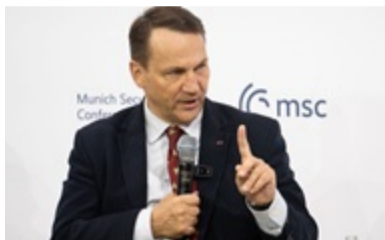
Сирський відреагував на позбавлення Ордена Зелєньського 11:47

Він критично висловився щодо рішення позбавити Володимира Зеленського польської відзнаки, назвавши це кроком, який важко вважати як морально справедливим, так і політично виправданим. Жовква підкреслив, що ця нагорода, якої президент України був удостоєний у 2023 році, стала символом вдячності за жертвний внесок українських військових, які ціною власних життів борються за майбутнє об'єднаной та безпечної Європи.