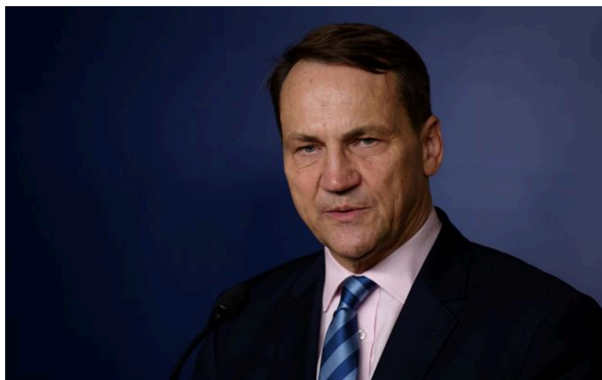
Фото: міністр закордонних справ Польщі Радослав Сікорський (Getty Images)

Не витрачай час на шум! Читай тільки суть з РБК-Україна у Google