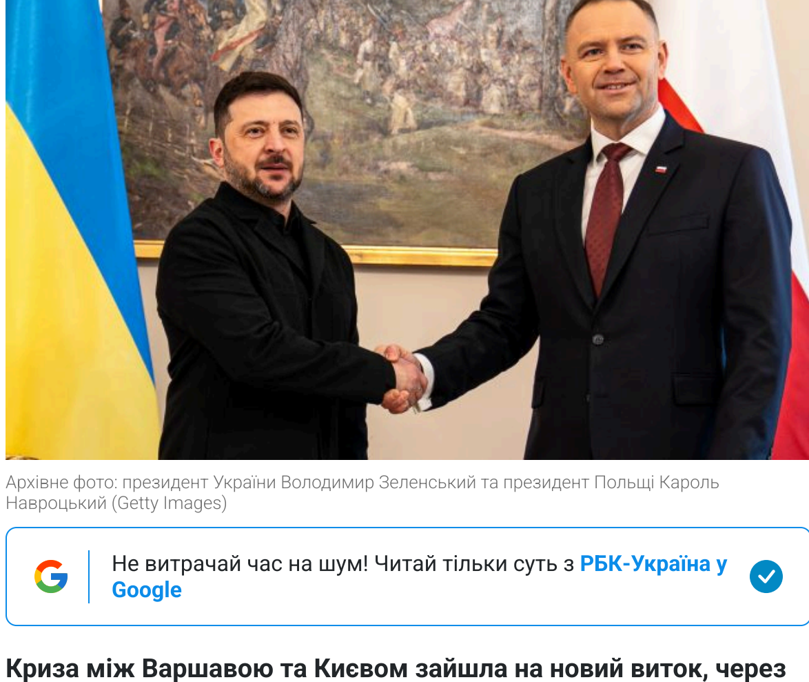
Архівне фото президента України Володимира Зеленського та президента Польщі Кароля Навроцького

Не витрачай час на шум! Читай тільки суть з РБК-Україна у Google