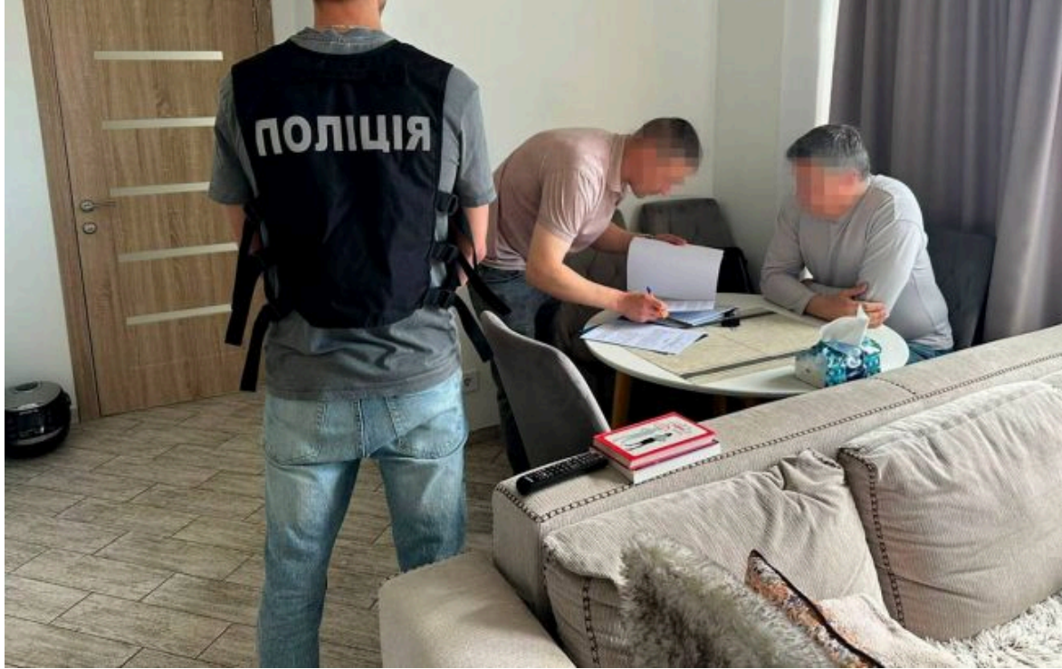
Фото: правоохоронці проводять слідчі дії у справі про незаконне переправлення осіб через державний кордон