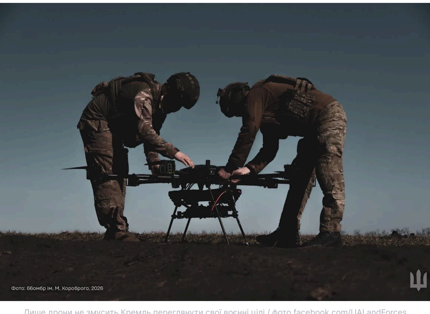
Лише дрони не зможуть Кремль переглянути свої воєнні цілі

Україна тепер здатна відповідати Росії її ж методами, але все ж не повністю, нагогосили журналісти.