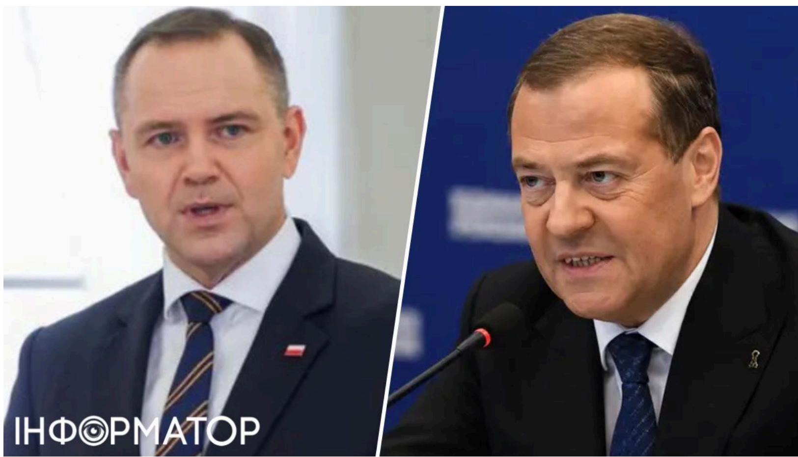
Медведєв схвалив дії Навроцького проти Зеленського

Заступник голови Ради безпеки Росії Дмитро Медведєв публічно привітав рішення президента Польщі Кароля Навроцького позбавити Володимира Зеленського ордена Білого Орла . Те, що Москва так швидко підхопила скандал, підтверджує: дія польського президента стала подарунком ворогові.