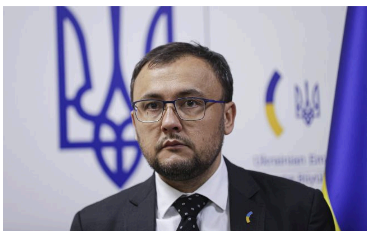
Фото: посол України у Польщі Василь Боднар

Не витрачай час на шум! Читай тільки суть з РБК-Україна у Google