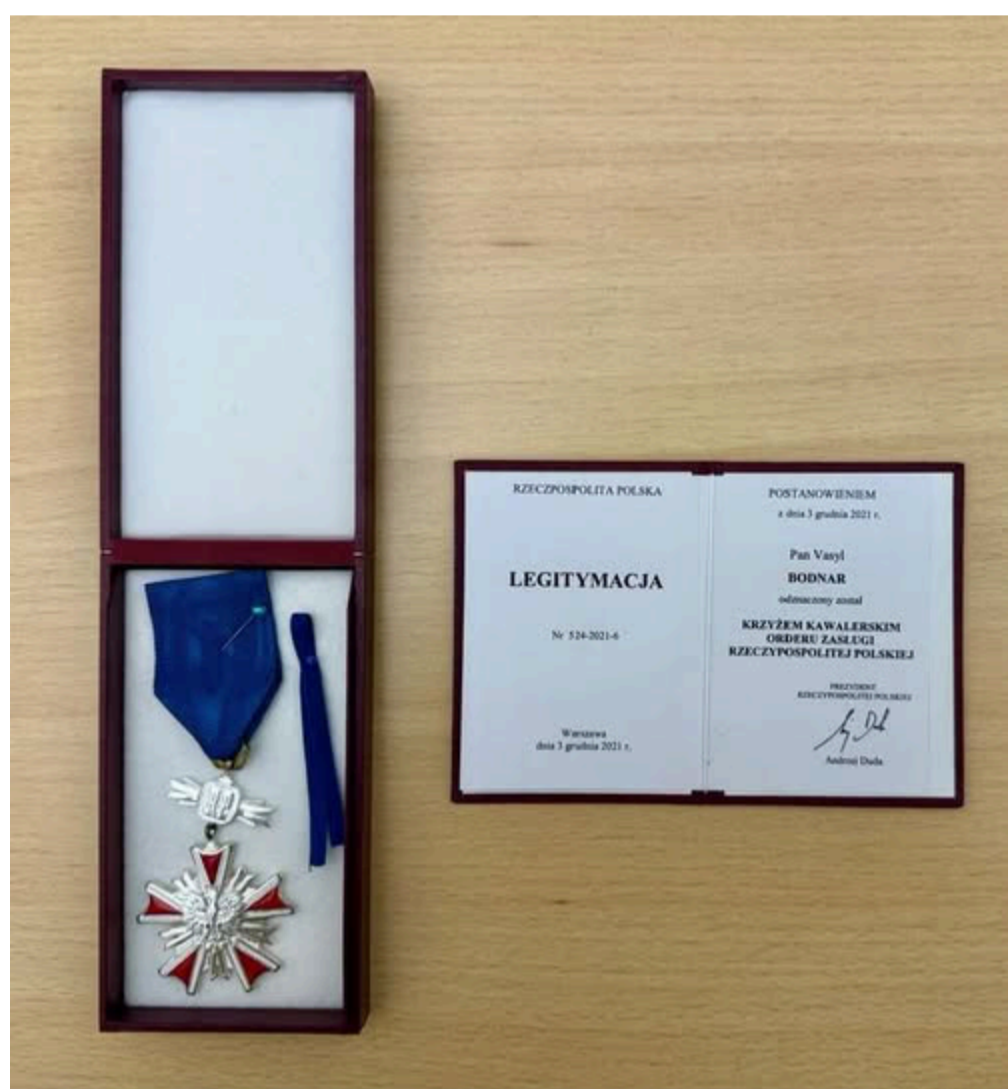
Фото: посол Боднар відмовився від польської нагороди

"За цих обставин я змушений повернути Кавалерський хрест Ордена "За заслуги Республіки Польща". Не зважаючи на сьогоднішню ситуацію, переконаний, що мудрість переможе емоції, а взаємна повага - політичну кон'юнктуру", - заявив Боднар.