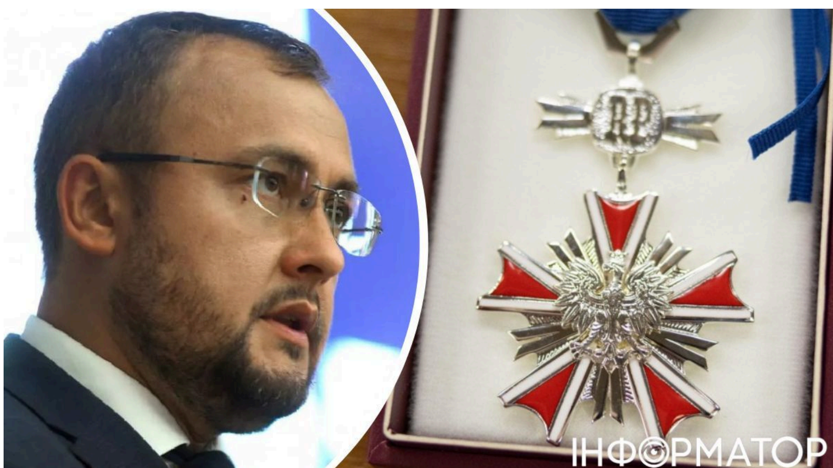
Боднар повернув польський орден в знак протесту

Надзвичайний і Повноважний Посол України в Польщі Василь Боднар оголосив, що повертає польську державну нагороду - у відповідь на рішення президента країни Кароля Навроцького. Навроцький увечері 19 червня позбавив президента Зеленського ордена Білого Орла - найвищої державної нагороди Польщі. Боднар назвав це рішення "історично несправедливим" і заявив, що воно сприймається боляче в умовах, коли Україна зазнає ракетних та дронівих ударів.