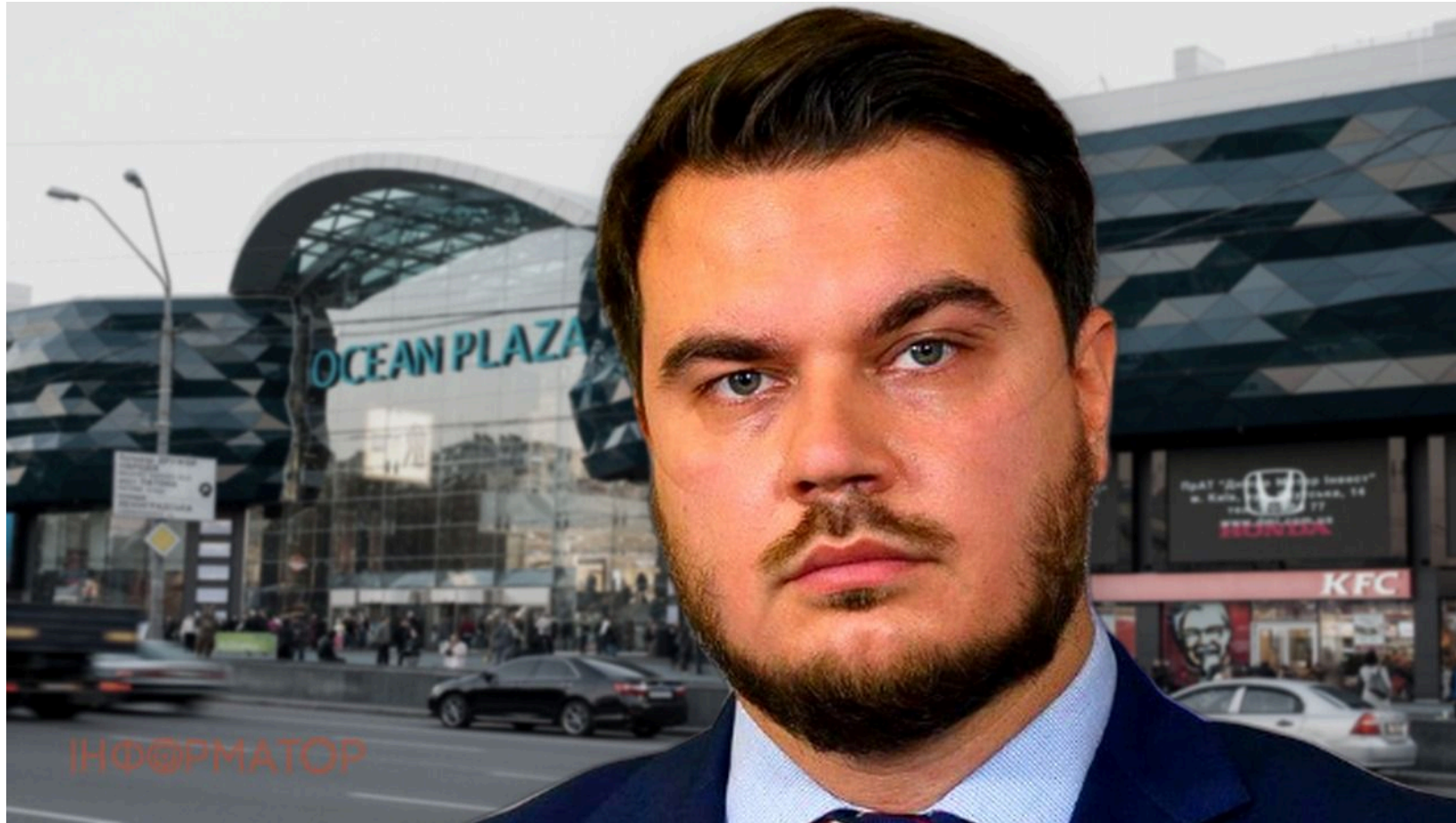
Наталуха заявив про скандал навколо продажу Ocean Plaza

Голова Фонду державного майна Дмитро Наталуха назвав обшуки прокурорів та поліції у чиновників ФДМУ спробою зірвати прозорий продаж київського ТРЦ Ocean Plaza. Раніше слідчі провели обшуки у будинках посадовців ФДМУ через підозри у навмисному заниженні вартості ТРЦ перед аукціоном. Наталуха відкинув ці звинувачення як безпідставні та абсурдні. На його думку, реальна мета силовиків - налякати потенційних покупців об'єкта та зірвати угоду на понад 11 млрд гривень.