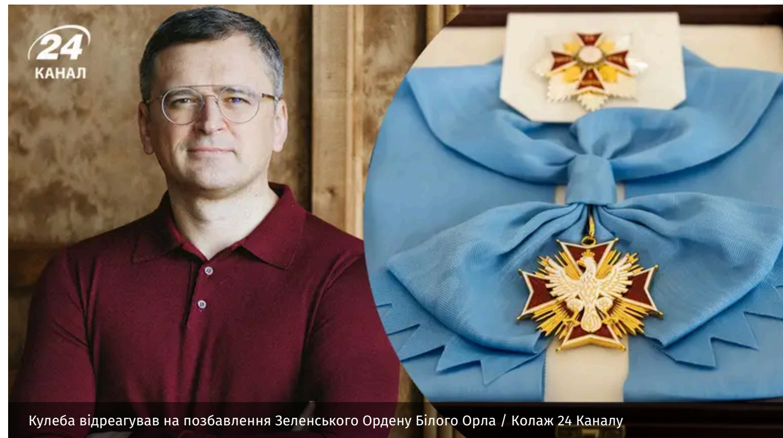
Кулеба відреагував на позбавлення Зеленського Ордену Білого Орла

Дмитро Кулеба відреагував на позбавлення Володимира Зеленського польського Ордену Білого Орла. Ексочільник українського МЗС нагадав президенту Польщі Каролю Навроцькому, які скандальні історичні постаті досі мають цю нагороду.