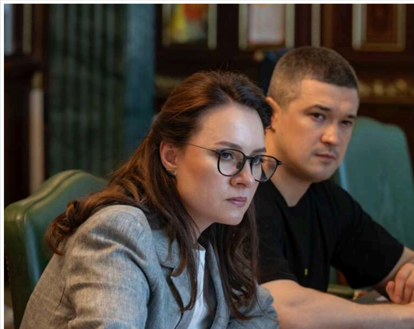
В Україні запустили платформу TrophyLab: партнери отримають доступ до даних про трофейну зброю РФ

Читати на русском Read in English Додати як бажане джерело в Google