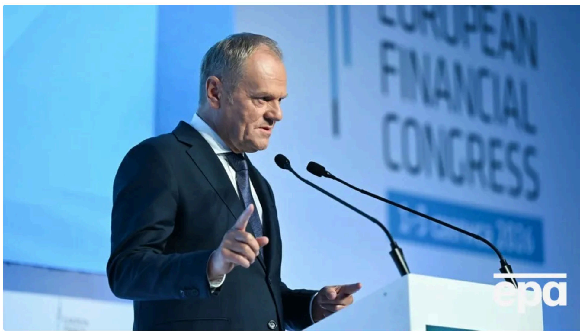
Туск висловився щодо рішення Навроцького про позбавлення Зеленського нагороди

Прем'єр-міністр Польщі Дональд Туск у соціальній мережі X 19 червня прокоментував рішення польського президента Кароля Навроцького позбавити президента України Володимира Зеленського ордена Білого Орла, який є найвищою державною нагородою Польщі.