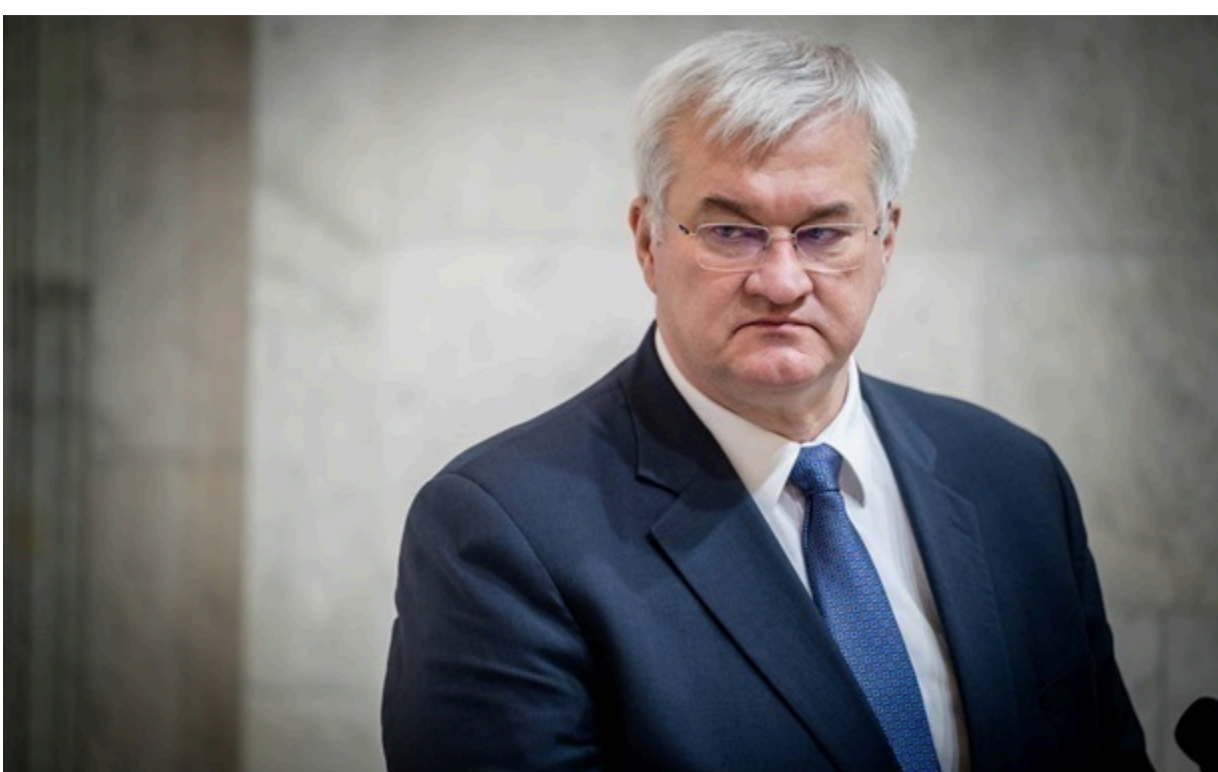
Сибіга заявив, що поверне Польщі високу державну нагороду

Міністр висловив сподівання, що згодом холодний розум візьме гору і польські друзі повернуться до рівноправного діалогу.