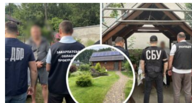
Схема із землею держлісфонду: на Закарпатті оголосили підозри шістьом особам