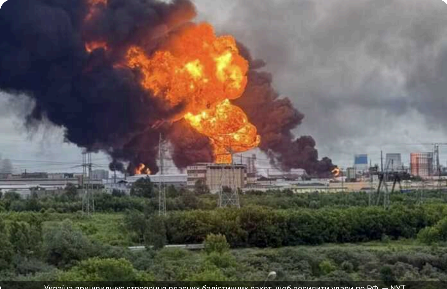
Україна пришвидшує створення власних балістичних ракет, щоб посилити удари по РФ, — NYT

Україна активізує зусилля з розробки власних балістичних ракет, оскільки, попри ефективність дронів, досі не має озброєння, яке є основою найруйнівніших повітряних атак Росії.