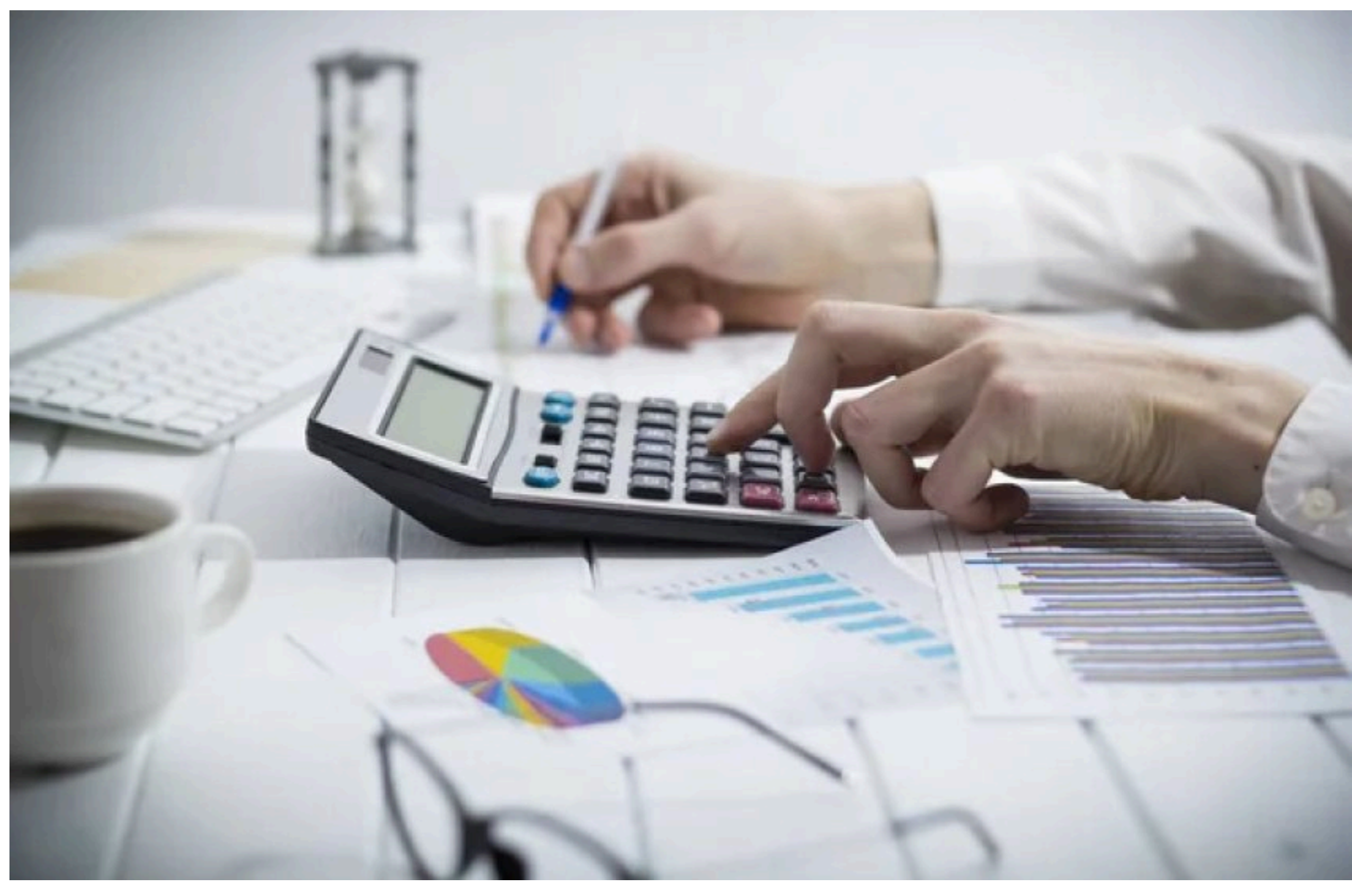
В Україні за пів року створять нову економічну стратегію на 10 років

Міжнародна консалтингова компанія McKinsey на засіданні Ради з питань підтримки підприємництва при президентові представила базові підходи до створення нової економічної стратегії України. Роботу над документом планують завершити за шість місяців.