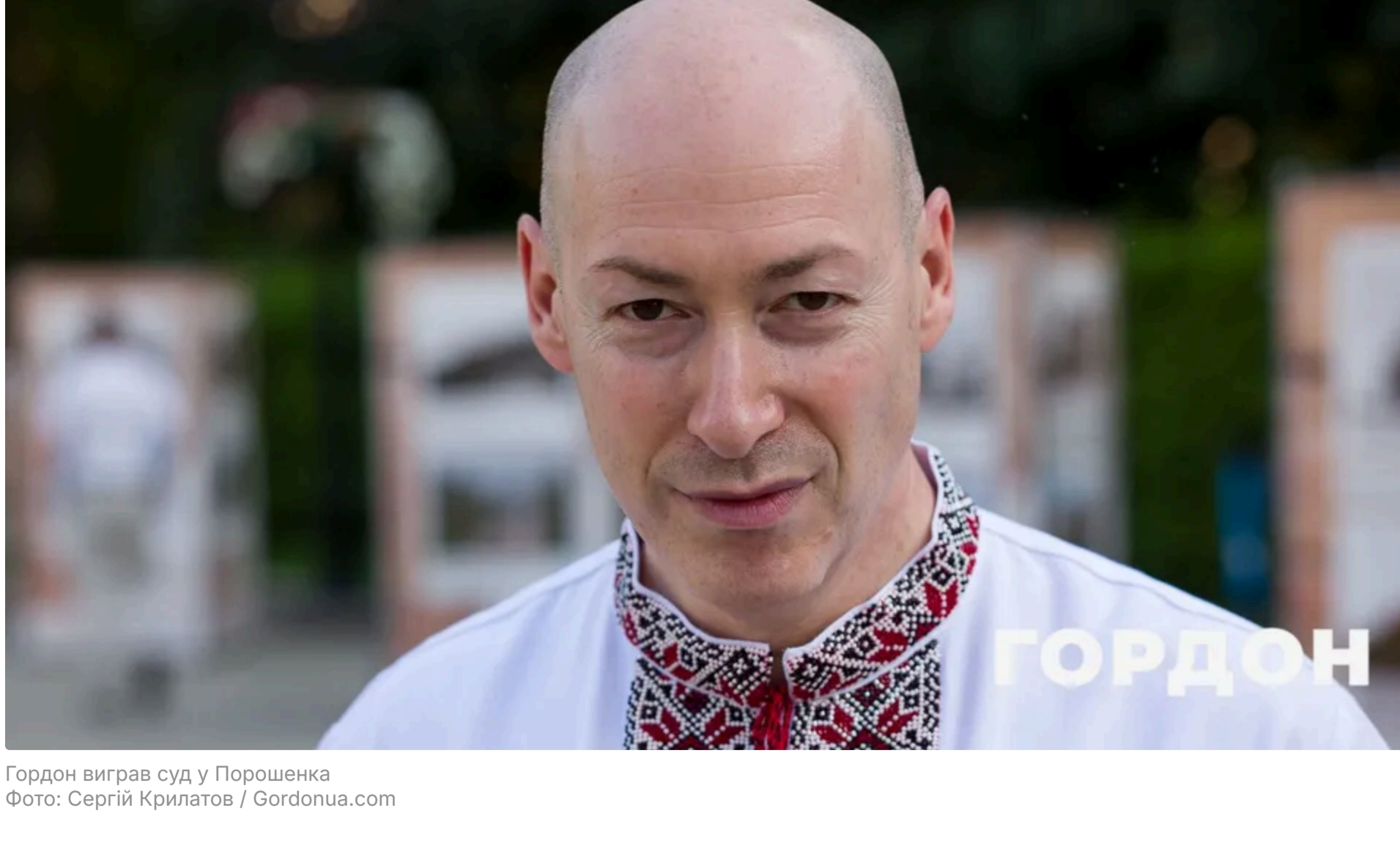
Гордон виграв суд у Порошенка

19 червня, 09:00 Цей матеріал також можна прочитати на російськ