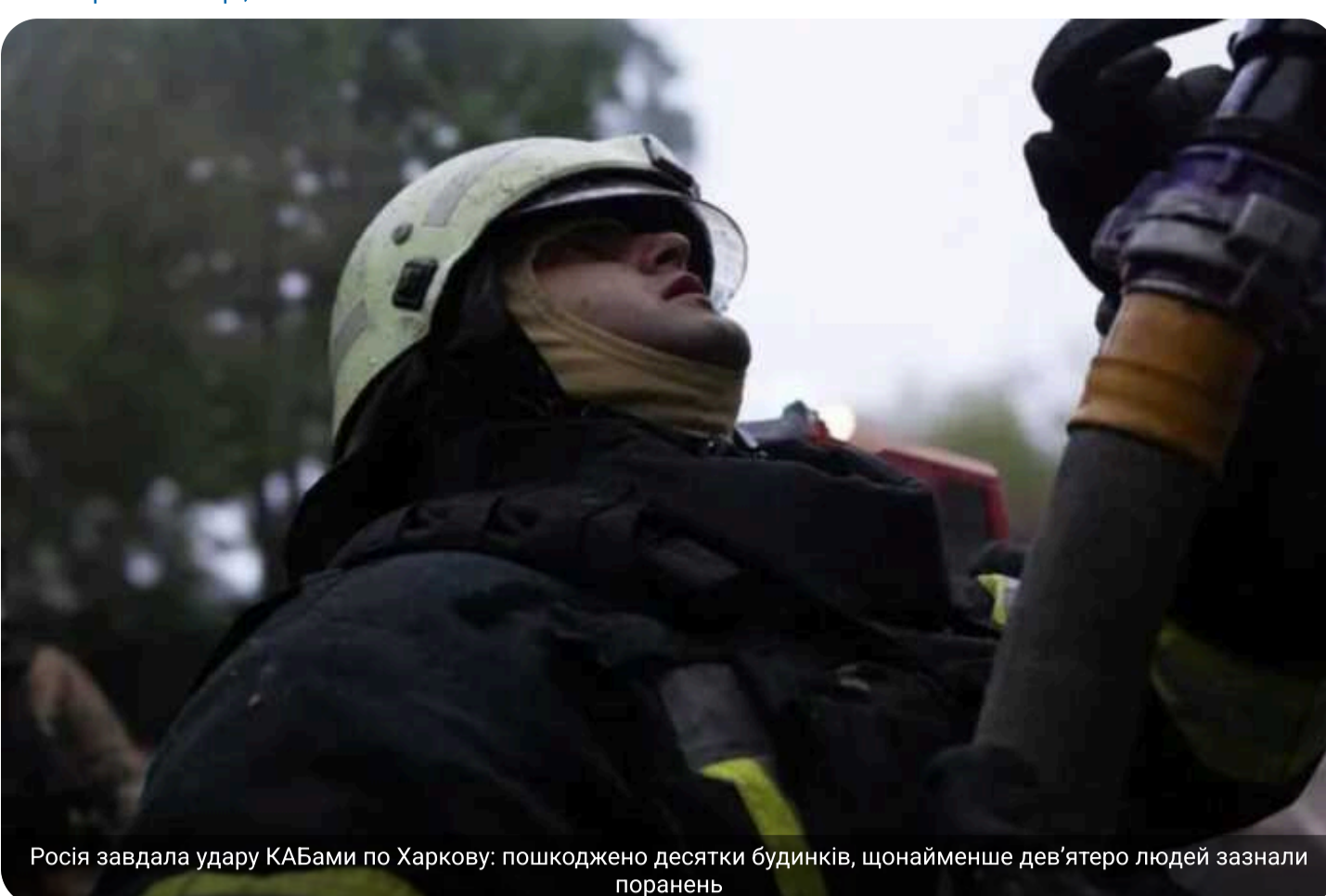
Росія завдала удару КАБами по Харкову: пошкоджено десятки будинків, щонайменше дев'ятеро людей зазнали поранень

Російські окупаційні війська здійснили обстріл Харкова із застосуванням керованих авіаційних бомб (КАБ). Основного удару зазнав Холодногірський район міста, де зафіксовано пошкодження десятків житлових будинків.