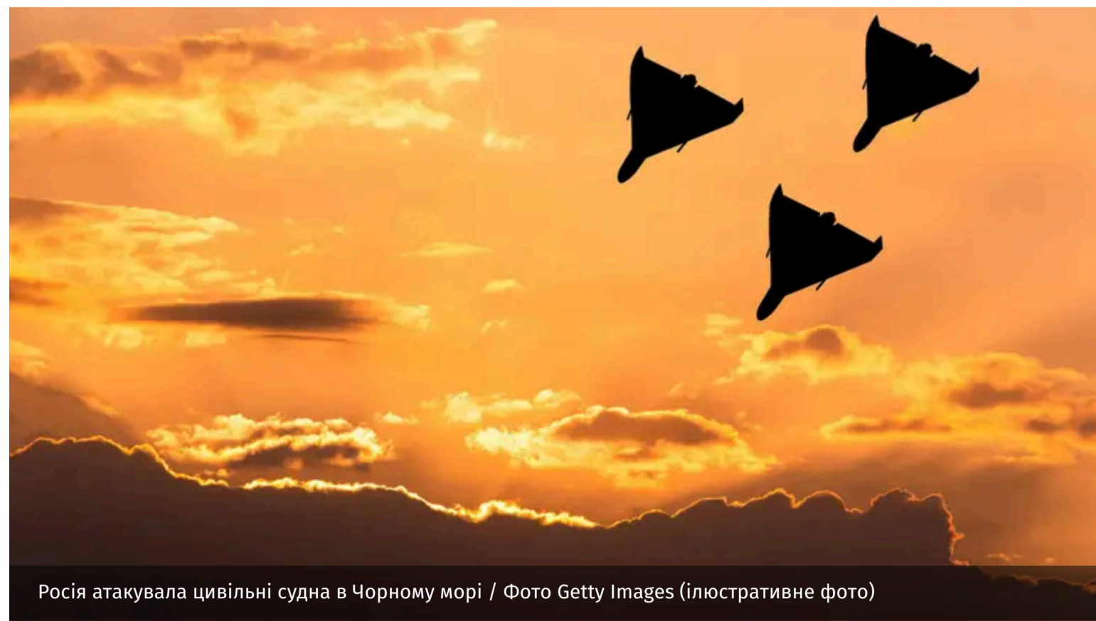
Росія атакувала цивільні судна в Чорному морі (ілюстративне фото)

У п'ятницю, 19 червня, російські ударні безпілотники атакували цивільні судна, які перебували в акваторії Чорного моря. Один член екіпажу загинув, ще п'ятеро отримали поранення.