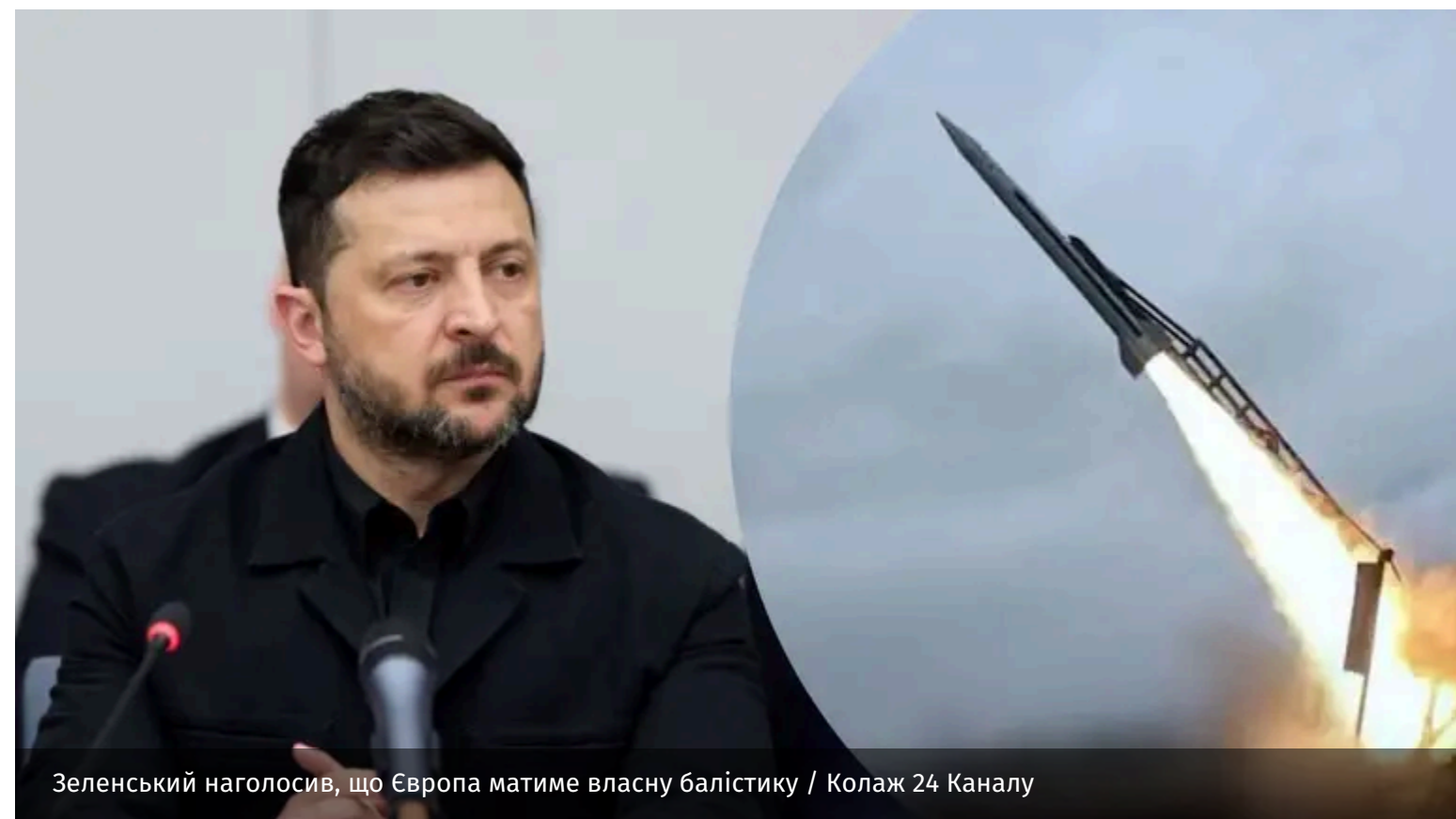
Зеленський наголосив, що Європа матиме власну балістику

18 червня у Брюсселі пройшли засідання у форматі "Рамштайн" та засідання ради України – Європейська рада. Володимир Зеленський вказав на важливу потребу Європи.