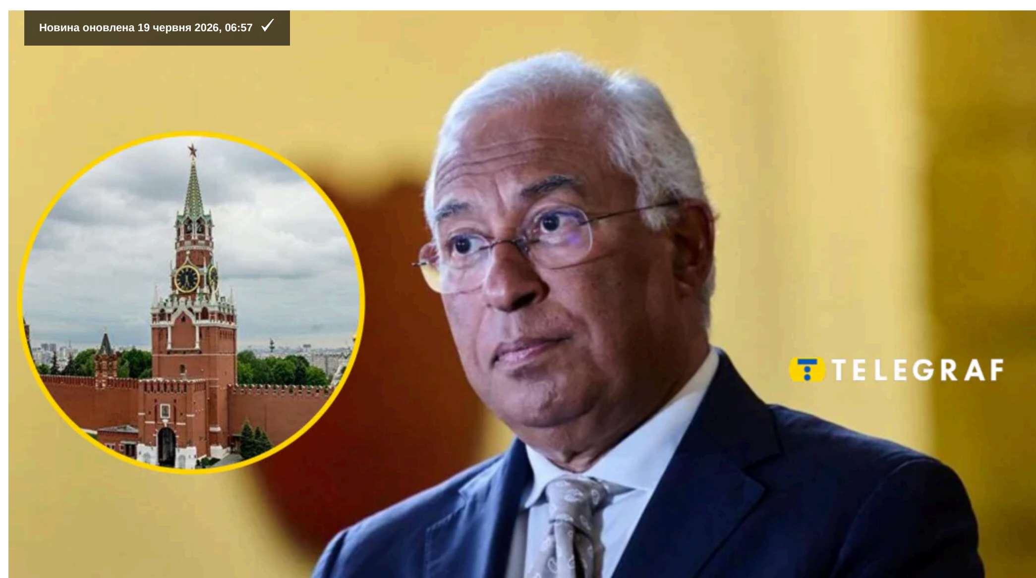
За словами Кошти, ЄС готується до майбутніх мирних переговорів.

Президент України Володимир Зеленський просить Європу брати більш активну участь у дипломатичних зусиллях