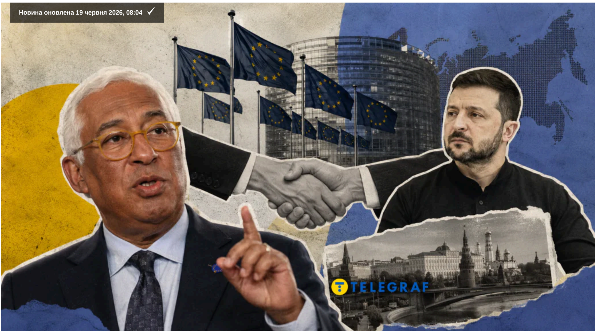
За словами Кошти, ЄС готується до майбутніх мирних переговорів.

Президент України Володимир Зеленський просить Європу брати більш активну участь у дипломатичних зусиллях