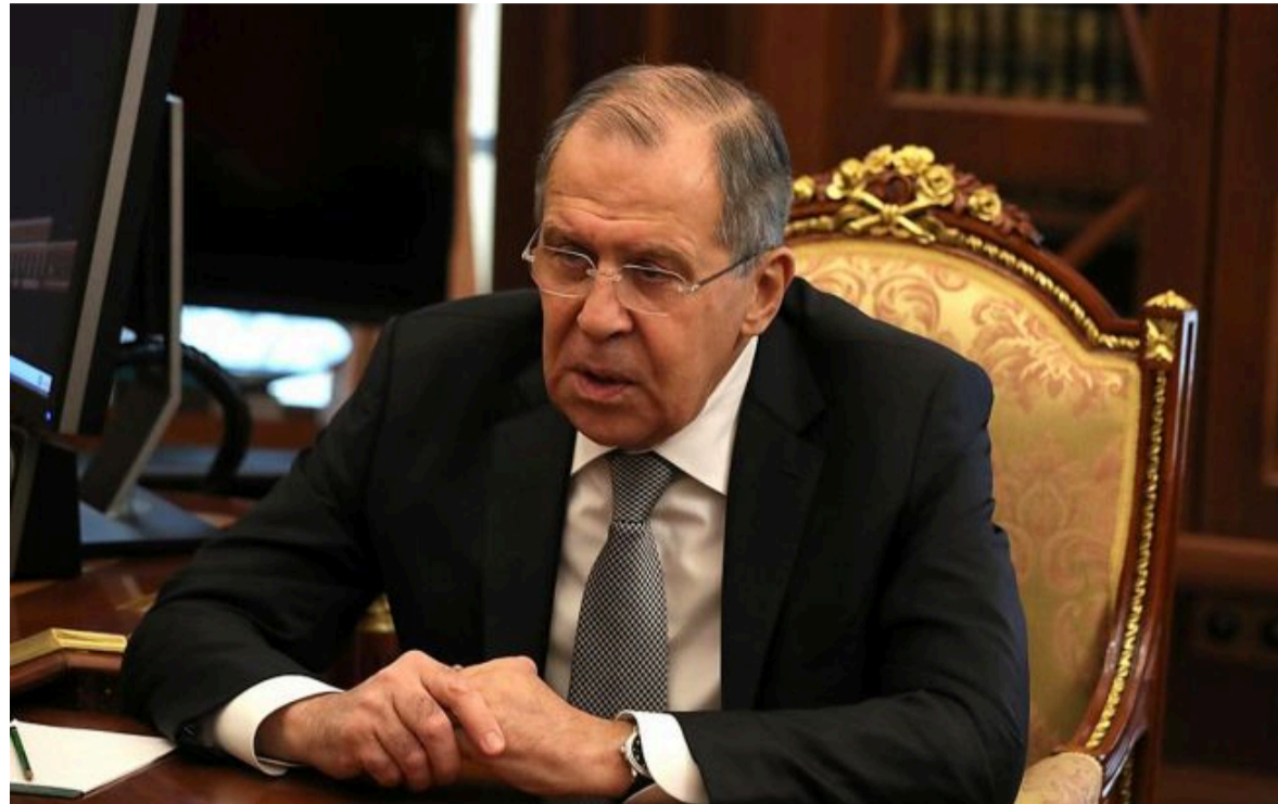
Фото: голова МЗС Росії Сергій Лавров (kremlin.ru)