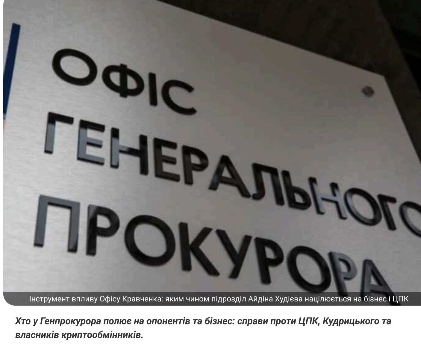
Інструмент впливу Офісу Кравченка: яким чином підрозділ Айдіна Худієва націлюється на бізнес і ЦПК

Хто у Генпрокуратури полює на опонентів та бізнес: справи проти ЦПК, Кудрицького та власників криптобізнесу.