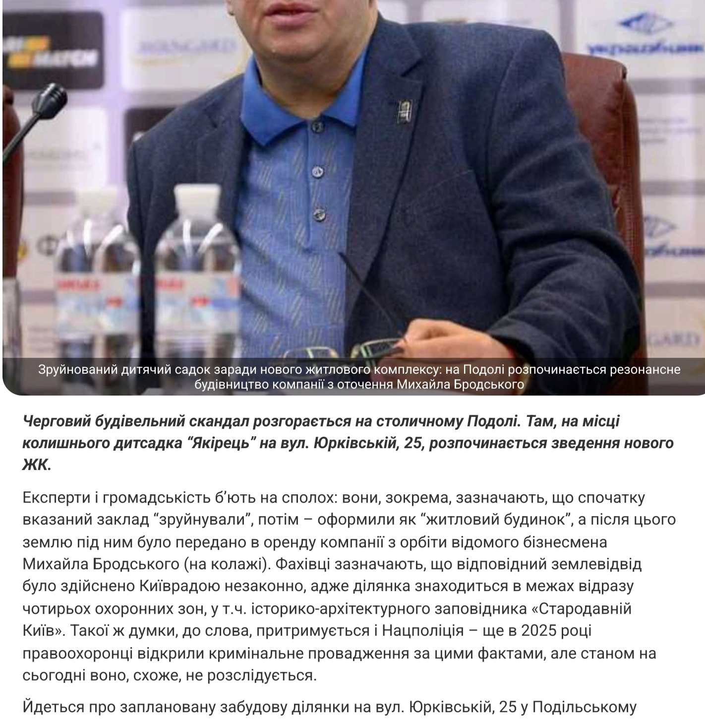
Зруйнований дитячий садок заради нового житлового комплексу: на Подолі розпочинається резонансне будівництво компанії з оточення Михайла Бродського

Черговий будівельний скандал розгоріється на столичному Подолі. Там, на місці колишнього дитсадака "Яриць" на вул. Юрківській, 25, розпочинається зведення нового ЖК.