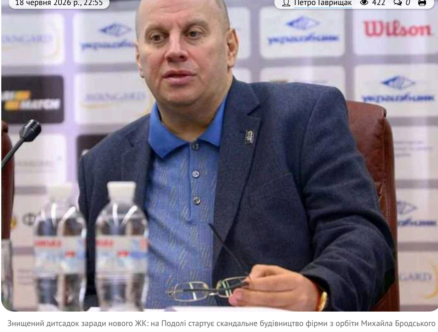
Знищений дитсадок заради нового ЖК на Подолі стартує скандальне будівництво фірми з орбіти Михайла Бродського

Черговий будівельний скандал розгортається на столичному Подолі. Там, на місці колишнього дитсадака "Якірець" на вул. Юрківській, 25, розпочинається зведення нового ЖК.